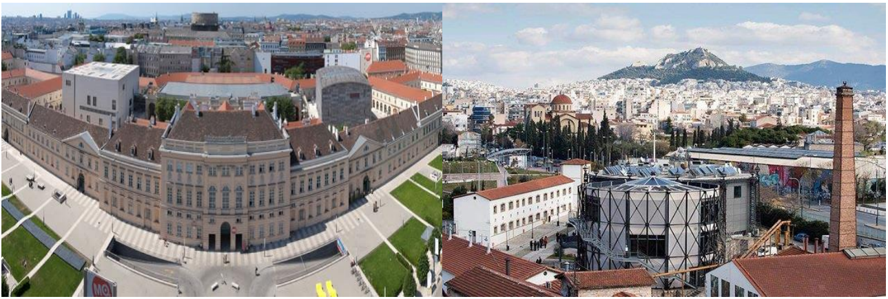
Εικόνα 3 (Αριστερά) Συνοικία των Μουσείων στη Βιέννη.