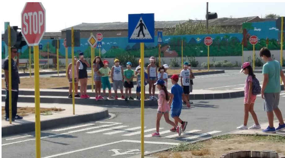
Εικόνα 21 Πάρκο Κυκλοφοριακής Αγωγής Ηράκλειο Αττικής.

της κυκλοφοριακής αγωγής, τα σήματα του ΚΟΚ, πως πρέπει να συμπεριφέρονται ως πεζοί, ποδηλάτες, αλλά και ως επιβάτες σε οχήματα και μέσα μαζικής μεταφοράς με βιωματικό τρόπο και προσωπική συμμετοχή 10 .