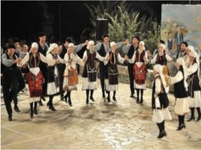
Εικόνα 17 (Αριστερά) Χορευτικό Συγκρότημα.