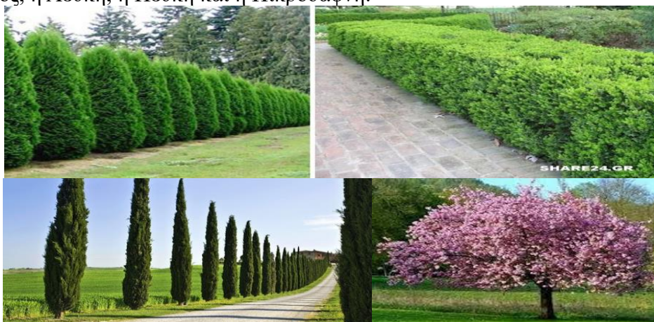
Εικόνα 10 (Πάνω) Πιττόσπορο για καθιστικούς χώρους.

Για να επιτευχθεί σκίαση το καλοκαίρι και ηλιασμός το χειμώνα, θα πρέπει η επιλογή των φυτών που θα διαλεχθούν να γίνει από εγνωσμένου κύρους και καταρτισμένους γεωπόνους με σκοπό τη βέλτιστη τοποθέτηση και διαμόρφωση του περιβάλλοντα χώρου. Τα φυτικά είδη που θα επιλεγούν θα πρέπει να είναι ανθεκτικά στις κλιματολογικές συνθήκες και να έχουν γρήγορη ανάπτυξη. Ενδεχομένως, στους καθιστικούς χώρους να χρησιμοποιηθούν φυλλοβόλα δέντρα και θάμνοι όπως Χαρουπιά, Δαφνοκέρασος, Μαόνια, Πιττόσπορο (Αγγελική) και Κουτσουπιά (Κότσικας). Από την άλλη μεριά, περιμετρικά του χώρου θα ευδοκίμουσαν ως ηχομονωτικά ή ανεμοθραύστες το Λιγούστρο, η Δάφνη, το Βιβούρνο, το Κυπαρίσσι και η Τούγια. Όσο για αρωματικά, καλλωπιστικά φυτά που συνάμα είναι ανθεκτικά στην ατμοσφαιρική ρύπανση είναι η Μανόλια, το Δεντρολίβανο, ο Χειμωνανθός, η Λεύκη, η Πεύκη και η Πικροδάφνη.