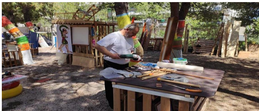
Εικόνα 20 Πάρκο Ανακύκλωσης & Περιβαλλοντικής Αγωγής στο Ηράκλειο Αττικής.

Για να ευαισθητοποιήσει ο Δήμος τόσο τους μαθητές όσο και τις οικογένειές τους, απαραίτητο θα ήταν να δημιουργηθεί ένα πάρκο «περιβαλλοντολογίας και ανακύκλωσης» με στόχο την γνωριμία, την συνειδητοποίηση της αξίας της και τους τρόπους που επιτυγχάνεται. Δέον θα ήταν να τοποθετηθούν «σπιτάκια ανακύκλωσης» σε ένα οργανωμένο χώρο, αλλά κυρίως να υπάρχουν διάσπαρτα μικροί κάδοι διαχωρισμού απορριμμάτων (πλαστικά, γυαλί ή χαρτί). Έτσι, θα αναγνωρίσουν όλοι οι δημότες, μικροί και μεγάλοι, την καταστροφή που υφίσταται η φύση, και ότι με τις προσπάθειες και τις δράσεις αυτές όλοι μπορούν να βοηθήσουν στην αντιμετώπιση της ρύπανσης, στην εξοικονόμηση υλικών και ενέργειας. Από τη θεωρία, είναι καλύτερη η πράξη, γι' αυτό το λόγο μπορεί να φτιαχτεί ένα μικρό διαδραστικό πάρκο ανακύκλωσης με παιχνίδια που διαπαιδαγωγούν και διαπλάθουν περιβαλλοντική συμπεριφορά όπως μίνι-μπάσκετ ανακύκλωσης, πετώντας στο σωστό κάδο τα απορρίμματα.