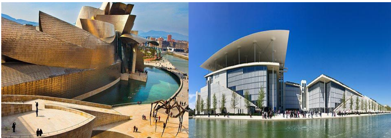
Εικόνα 1 (Αριστερά) Μουσείο Guggenheim Bilbao.

Προκρίνεται η ήδη υπάρχουσα ταυτότητα μιας περιοχής, η οποία ενισχύεται με «έργα ναυαρχίδες» (flagships projects), είτε υπό την μορφή πολιτιστικών συνοικιών, είτε κέντρων ψυχαγωγίας και πολιτισμού, είτε κολοσσιαίων μουσείων. Πρόκειται, ειδικότερα, για έργα μεγάλης κλίμακας και μεταμοντέρνας αρχιτεκτονικής, όπου συνήθως στεγάζονται μουσεία, επιχειρηματικά κέντρα, εκθεσιακοί χώροι, θεματικά πάρκα, αθλητικές και πολιτιστικές δραστηριότητες. Το βασικό χαρακτηριστικό τους είναι ότι αναβαθμίζουν τον περιβάλλοντα χώρο και παράλληλα ενισχύουν την τοπική οικονομία, αφού προσελκύουν συνάμα και έργα μικρότερης ανάπτυξης που τα πλαισιώνουν (Hall T., 2005). Τα «έργα ναυαρχίδες» έχουν διττό στόχο, αφενός λειτουργούν ως πόλοι έλξης επισκεπτών και επενδυτών, ώστε να αναπτυχθεί έτι περαιτέρω η τοπική οικονομία και αφετέρου αποτελούν τοπόσημα της περιοχής που αναπλάστηκε. Χαρακτηριστικά παραδείγματα αποτελούν το μουσείο Guggenheim στο Μπιλμπάο και το Ίδρυμα Σταύρος Νιάρχος στην Αθήνα.