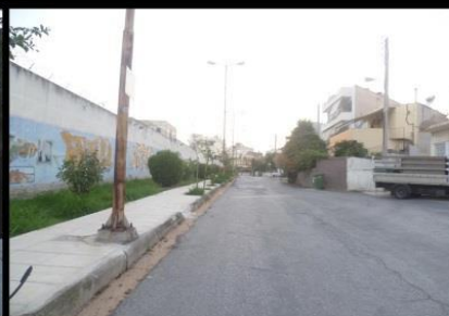
Απέναντι από το ίδρυμα υπάρχουν πολυκατοικίες που ξεπερνούν το ύψος του τοίχους και υπάρχει οπτική επαφή κατοίκων-φυλακισμένων