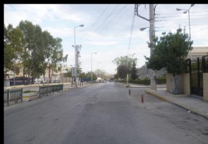
Αθλητικό γήπεδο και σχολικό συγκρότημα βρίσκονται απέναντι από τις φυλακές