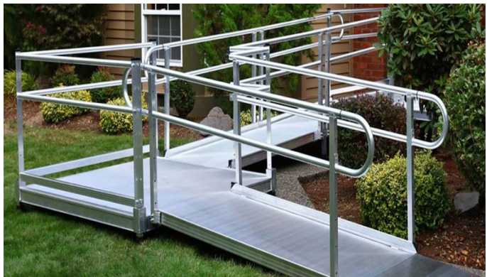
Εικόνα 14 (Δεξιά) Ράμπες για άτομα με κινητικά προβλήματα.