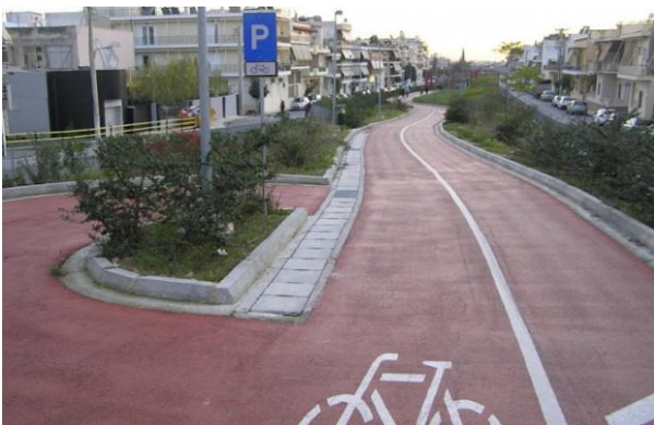
Εικόνα 13 (Αριστερά) Ποδηλατόδρομος.

Όσον αφορά τις πλακοστρώσεις , θα πρέπει να έχουν αντιολισθητική και ομαλή επιφάνεια για την αποφυγή και τη μείωση ατυχημάτων. Ενδεχομένως, η επιλογή κάποιου φυσικού, πολύχρωμου και συνάμα παραδοσιακού λίθου, να προσδώσει αισιοδοξία και χρώμα στο μονότονο, ψυχρό αστικό τοπίο. Απαραίτητο καθίσταται για να μην αποκλειστεί κάποιος πολίτης από τα δημόσια αγαθά και υπηρεσίες, η διαμόρφωση της νέας εκτάσεως να γίνει φιλική και προσβάσιμη για όλες τις ευπαθείς κατηγορίες . Οι πλακοστρώσεις θα πρέπει να φτιαχτούν με τέτοιο τρόπο, ήτοι σε ράμπες ή σε ανισόπεδες επιφάνειες δίχως την ύπαρξη σκαλοπατιών με σκοπό την εξυπηρέτηση ανθρώπων με κινητικά προβλήματα, γονέων με παιδιά, ιδίως σε βρεφικά καροτσάκια και της τρίτης ηλικίας. Θα πρέπει να μελετηθούν ειδικές διαδρομές για τους τυφλούς ή ανθρώπους με προβλήματα όρασης με ειδικές πλάκες που θα οδηγούν σε ασφαλείς διαδρομές κατά τη διέλευση τους από την πρώτη έκταση των φυλακών.