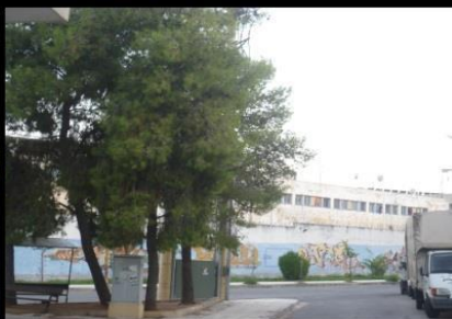
Τα κτίρια του ιδρύματος ξεπερνούν σε ορισμένες περιπτώσεις το ύψος του τοίχους