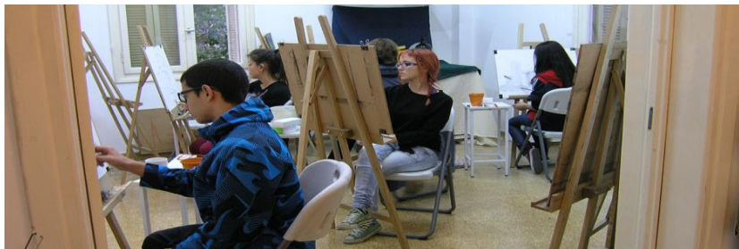
Εικόνα 16 Δημιουργικό Κέντρο.

Ειδικότερα, τη δημιουργία καλλιτεχνικής γωνιάς , η οποία θα περιλαμβάνει ζωγραφική, φωτογραφία, χαρακτική, γλυπτική, κόσμημα, αιογραφία, ψηφιδωτό, βιτρό, κεραμική, χειροτεχνία, κέντημα παραδοσιακών βελονιών, πλέξιμο και ντεκουπάζ. Όλα αυτά τα αντικείμενα μάθησης έχουν ως σκοπό την προσφορά μέσα από την καλλιτεχνική έκφραση. Διά αυτών των τμημάτων δεν θα αναπτυχθούν οι πολίτες μόνο πνευματικά και επιμορφωτικά, αλλά παρέχεται και η δυνατότητα για όσους το επιθυμούν να τα χρησιμοποιήσουν για ενίσχυση και βελτίωση των οικονομικών τους πόρων, ή και βιοποριστικά. Επίσης, χρήσιμο θα ήταν να σχηματισθούν τμήματα μαθημάτων και σεμιναρίων μαγειρικής και ζαχαροπλαστικής για όλες τις ηλικίες, ακόμη και για μαθητές, τα οποία θα μνήσουν τους συμμετέχοντες σε νέες, ευεργετικές διατροφικές συνήθειες και παράλληλα θα εμπλουτίζουν διατροφικά τα αγαπημένα τους πιάτα για να απολαμβάνουν ποιοτικότερη θρέψη. Ειρήσθω εν παρόδω, τα παρασκευάσματα που φτιάχνονται μπορούν να προσφερθούν στα κοινωνικά συσσίτια του Δήμου.