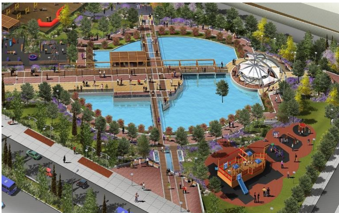
Εικόνα 9 Πρόταση Ανάπλασης της έκτασης των πρώην γυναικείων φυλακών Κορυδαλλού.

αποτελέσει μια δυναμική, εξελισσόμενη και αναπτυσσόμενη βιομηχανία αναβαθμίζοντας την πόλη και την τοπική κοινωνία λειτουργικά, πολιτιστικά, κοινωνικά και οικονομικά.