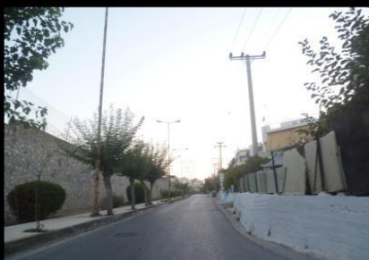
Οι κατοικίες της γειτονιάς βρίσκονται σε μικρή απόσταση από το όριο της φυλακής, το οποίο δεν ξεπερνά τα 3-4 μέτρα σε ύψος