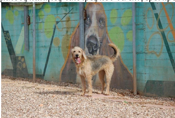
Εικόνα 19 Πάρκο Σκύλων στο Μαρούσι.

Τέλος, μια ιδιαίτερη κατηγορία πολιτισμού είναι η μέριμνα για τους τετράποδους φίλους μας. Προτείνεται η δημιουργία πάρκου ζώων , φυλασσόμενου και περιφραγμένου, ως εκτέθηκε και ανωτέρω που θα περιλαμβάνει ειδικές εγκαταστάσεις με παιχνίδια και όργανα που εκτός από τη ψυχαγωγία, θα τα βοηθήσουν στην εξάσκηση και εκγύμνασή τους. Κατ' αυτόν τον τρόπο, το κατοικίδιο μπορεί να ασκηθεί σωστά και να αποκτήσει υγιή φυσική κατάσταση, όπως εξοικείωση και κοινωνικοποίηση με άλλα κατοικίδια, νέες μυρωδιές και περιβάλλοντα 9 . Επιπλέον, καλό θα ήταν να υπάρχουν καναπεδάκια και κιόσκια για τους ιδιοκτήτες και συνοδούς, ώστε να μπορούν και αυτοί να χαλαρώσουν όσο θα παίζει το τετράποδο. Ο χώρος αυτός θα περιλαμβάνει διάσπαρτα ποτίστρες, καθώς και αυτόματους πωλητές-ταΐστρες που θα επιφέρει πρόσοδο στο Δήμο.