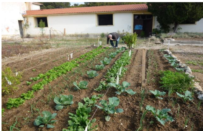
Εικόνα 22 Ομάδα ΠΕΡ.ΚΑ στο Στρατόπεδο Κόδρα στη Θεσσαλονίκη.

Μια τάση που παρατηρείται σε πολλές ευρωπαϊκές πόλεις είναι η μετατροπή των αστικών κενών σε χώρους αστικής καλλιέργειας . Τόσο οι Οργανισμοί Τοπικής Αυτοδιοίκησης μέσω προγραμμάτων, όσο και οι τοπικοί σύλλογοι και οργανώσεις διαθέτουν δημόσιους χώρους προς εκμετάλλευση για τη δημιουργία αστικών λαχανοκήπων, όπου οι φτωχότερες πληθυσμιακές ομάδες θα μπορούν να παράγουν, καταναλώνουν ή να διαθέτουν τα προϊόντα αυτά στο κοινωνικό παντοπωλείο και σε άλλα μέρη που υπάρχει ανάγκη. Έτσι, μέσω των αυτοδιαχειριζόμενων καλλιεργειών αντιμετωπίζονται πολλά προβλήματα επισιτισμού των νοικοκυριών, ως απόρροια της οικονομικής κρίσης. Τέτοια ομάδα στην Ελλάδα αποτελεί η ΠΕΡ.ΚΑ 12 με έντονη δραστηριότητα σε εγκαταλελειμμένους χώρους όπως παλιά στρατόπεδα της Θεσσαλονίκης. Κατ' αντίστοιχο τρόπο, θα μπορούσε να εφαρμοστεί ανάλογη δράση και σε τμήμα των κενών αστικών χώρων των παλαιών φυλακών του Δήμου Κορυδαλλού.