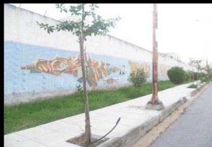
Γκραφίτι κοσμούν μία μεριά του τοίχους, τα οποία μαρτυρούν τη σχέση των νέων της γειτονιάς με το ίδρυμα