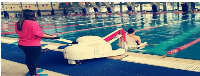
Εικόνα 15 Ειδικό αναβατήριο για ΑμεΑ.

Μια βασική έλλειψη στο Δήμο Κορυδαλλού αποτελεί η απουσία Κολυμβητηρίου . Το έργο υποδομής αυτό έχει ζητηθεί πολλάκις από τους κατοίκους της περιοχής για τη βελτίωση της αθλητικής ζωής των δημοτών και ταυτόχρονα της διεύρυνσης των παροχών εκ μέρους του Δήμου. Το εν λόγω έργο αυτή τη στιγμή βρίσκεται σε πρώιμο στάδιο έγκρισης κατασκευής 8 . Θα πραγματοποιηθεί στο χώρο των 88 στρεμμάτων, ήτοι στον χώρο που βρίσκεται πέριξ των φυλακών. Το έργο εντάσσεται στον γενικότερο προγραμματισμό της δημοτικής αρχής για την ανάπτυξη των αθλητικών υποδομών, που έχουν ανάγκη οι δημότες και η νεολαία της πόλης. Πρόκειται για ένα σύγχρονο κλειστό κολυμβητήριο με διαφορετικές πισίνες ανάλογα με την ηλικία, είτε ενηλίκων, είτε ανηλίκων. Ενδεικτικό θα ήταν το κολυμβητήριο να αποκτήσει εγκαταστάσεις για θερμαινόμενες πισίνες ώστε το νερό να είναι ανεκτό για ευαίσθητες επιδερμίδες όπως και για το δέρμα βρεφών. Μια, επιπλέον, πρόταση που απαραίτητως θα πρέπει να ληφθεί υπόψιν είναι η πρόσβαση και η χρήση του χώρου από ΑμεΑ και από άτομα με κινητικά προβλήματα. Θα πρέπει να υπάρχει πρόβλεψη για γερανό που θα διευκολύνει με ασφάλεια την είσοδο και την έξοδο από την πισίνα και ειδικές ράμπες για πρόσβαση στα αποδυτήρια του κολυμβητηρίου.