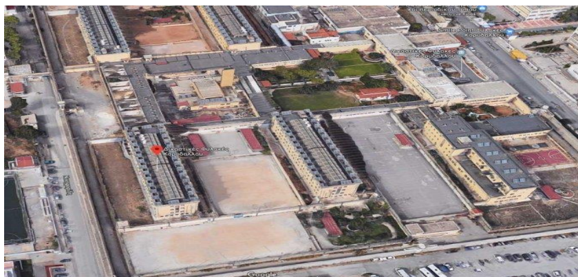
Εικόνα 7 Φυλακές Κορυδαλλού (αεροφωτογραφία).

Οι φυλακές στον Δήμο Κορυδαλλού καταλαμβάνουν χώρο 130 στρεμμάτων, όπου 76 περίπου στρέμματα είναι οι Ανδρικές Φυλακές, 25 στρέμματα οι Γυναικείες Φυλακές και 28 στρέμματα το Αναμορφωτήριο, και τα εν λόγω στρέμματα έχουν χαρακτηριστεί ως εκτός εγκεκριμένου σχεδίου. Το Γενικό Πολεοδομικό Σχέδιο του Κορυδαλλού εισηγούνταν μεγάλο χρονικό διάστημα την απομάκρυνση των Φυλακών με σκοπό την παράλληλη δημιουργία κοινωφελών χρήσεων στον χώρο που θα απομείνει, απελευθερώνοντας εκτάσεις από το ήδη εγκεκριμένο Ειδικό Πλαίσιο Χωροταξικού Σχεδιασμού και Αειφόρου Ανάπτυξης για τα Σωφρονιστήρια.