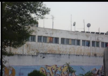
Έτσι γίνεται εύκολη την οπτικοακουστική σχέση κρατουμένων και κατοίκων

Εικόνα 8 Σχέση Φυλακών και Γειτονιάς.