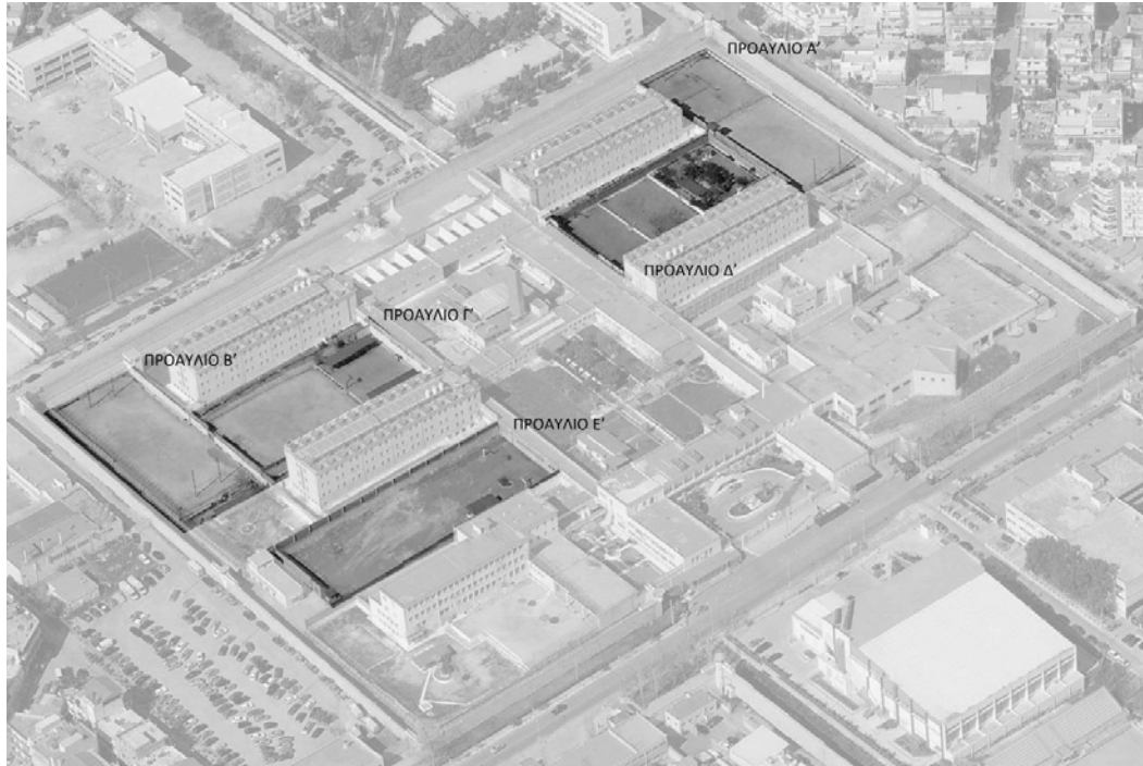
Εικόνα 5: Προοπτική απεικόνιση των ανδρικών φυλακών Κορυδαλλού, εστιάζοντας στα προαύλια (Καλυμνίου, 2015, σ.33).