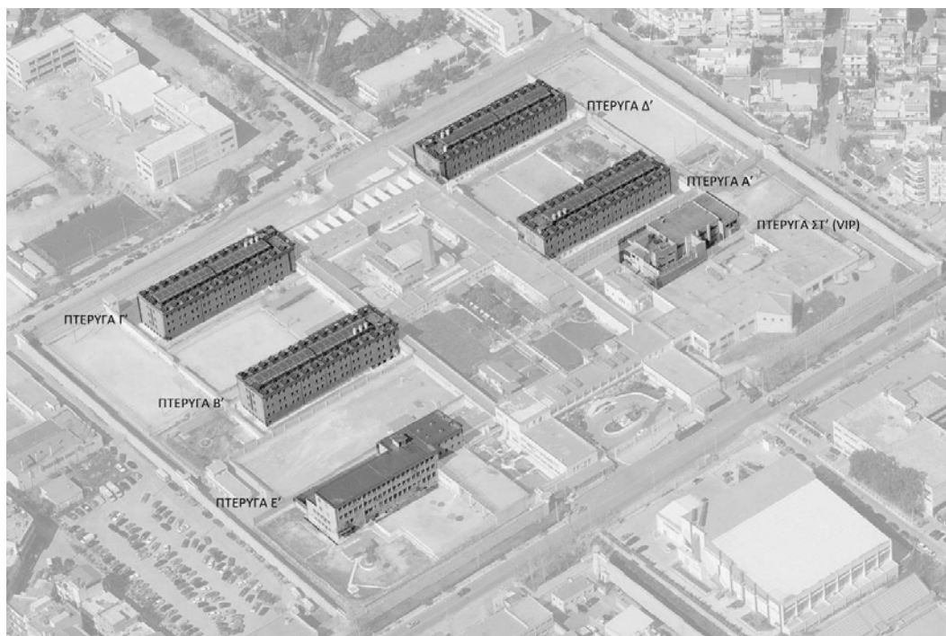
Εικόνα 4: Προοπτική απεικόνιση των ανδρικών φυλακών Κορυδαλλού, εστιάζοντας στις πτέρυγες (Καλυμνίου, 2015, σ.31).

Οι φυλακές διαχωρίζονται από την υπόλοιπη πόλη με έναν περιμετρικό τοίχο που τις περιβάλλει χωρίς παρόλα αυτά να αποκλείει εντελώς την οπτική επαφή με τον εσωτερικό χώρο. Μπορεί εύκολα κανείς να διακρίνει τα υπερυψωμένα φυλάκια ή τα κελιά που βρίσκονται στους τελευταίους ορόφους των πτερύγων.