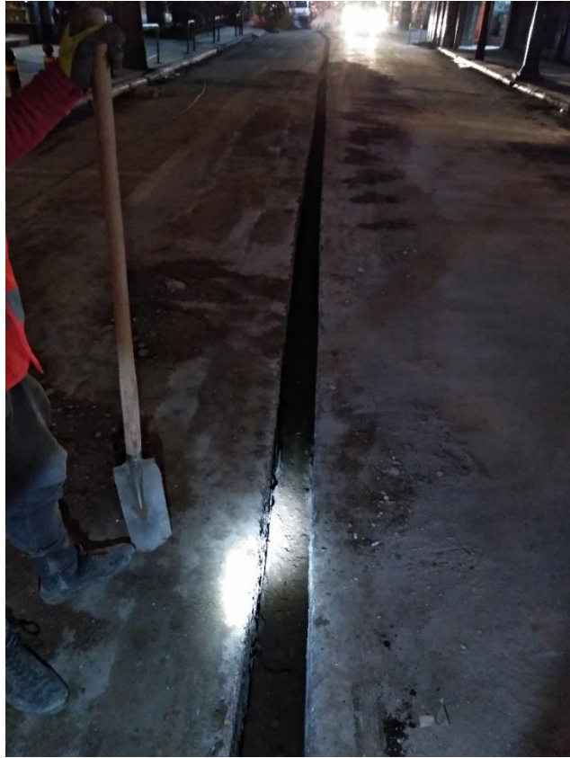
Εικόνα 4. Εκτέλεση εργασιών στο πλαίσιο του έργου NGA Wind (εγκατάσταση οπτικών ινών, μικροτάφρος διαστάσεων 0,15 X 0,60 μ.), Σύνταγμα.