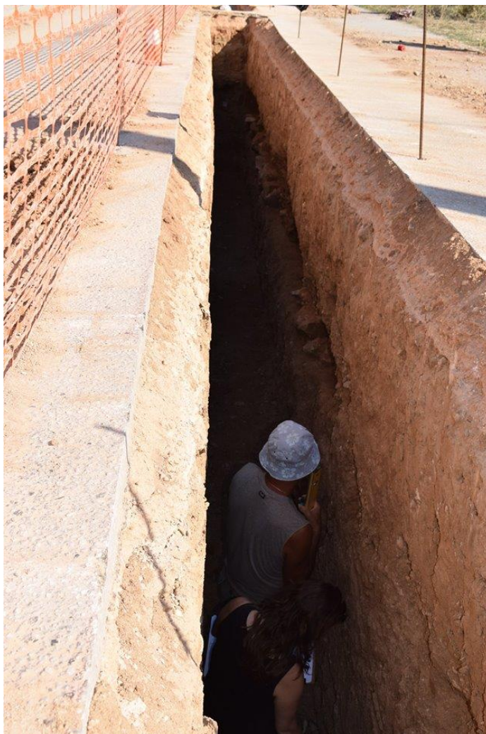
Εικόνα 1. Εκτέλεση ανασκαφικών εργασιών στο πλαίσιο του έργου Β' φάση Βιολογικού Καθαρισμού Μεγάρων.