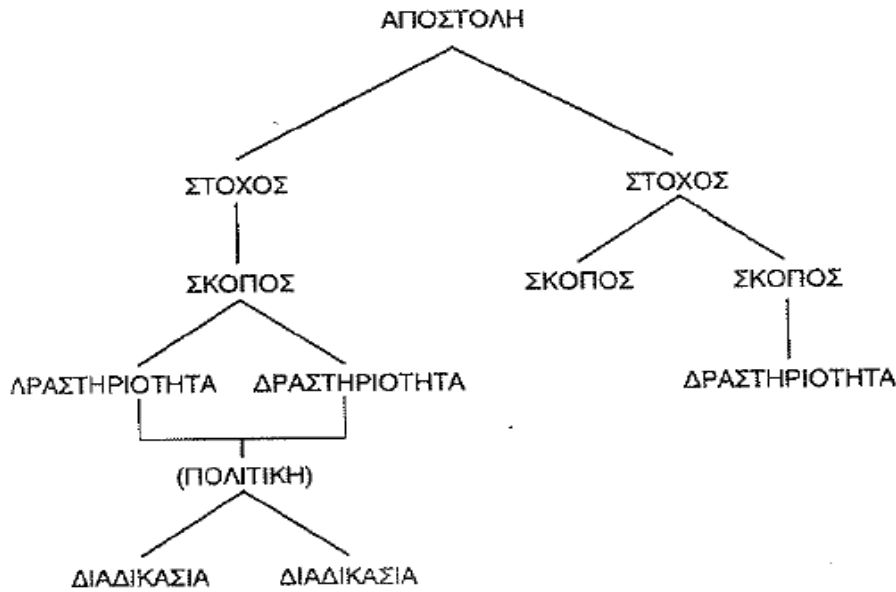
Σχήμα 1 Ιεραρχία σκοπών 9

Στις παραπάνω έννοιες για την επιτυχία θετικού αποτελέσματος υπάρχει ιεραρχία (για την εκκίνηση από κάτω προς τα πάνω, για την πραγμάτωση από πάνω προς τα κάτω) και αλληλεξάρτηση. Μια άλλη έννοια που δημιουργεί τις προϋποθέσεις για τη θετική ή αρνητική εφαρμογή των παραπάνω είναι η πολιτική. Το σχήμα 1 δείχνει αυτή την ιεραρχία.