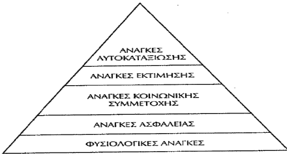
Σχήμα 3 Η ιεράρχηση των αναγκών κατά τον Maslow 14