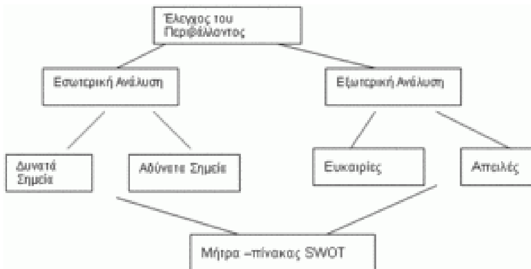
Εικόνα 3.1: Ανάλυση Αγοράς S.W.O.T. ANALYSIS