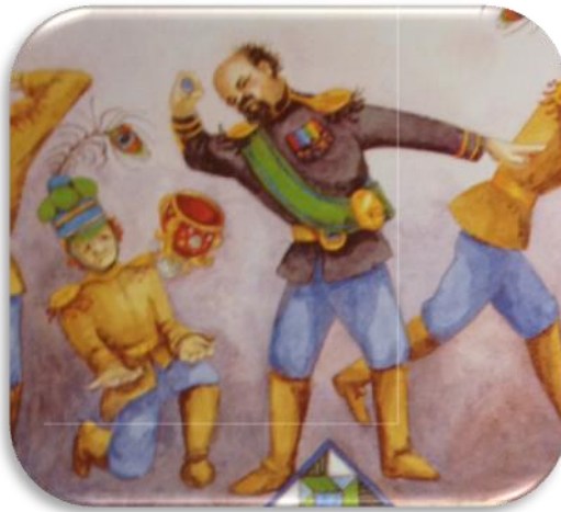
(4.Brumbeau, J. (2002). Το Δώρο της Παπλωματούς).

Συνοψίζοντας τα αποτελέσματα σχετικά με τη σύνδεση του γνωρίσματος της Συναισθηματικής Σταθερότητας/ Νευρωτισμού με την Ευτυχία, γενικά η Ευτυχία προβάλλεται με σημαντική έμφαση σχεδόν σε όλα τα παιδικά βιβλία που μελετήθηκαν να συνδέεται θετικά με χαμηλό βαθμό Νευρωτισμού ή υψηλό βαθμό Συναισθηματικής Σταθερότητας. Ειδικότερα, τα άτομα προβάλλονται να αντιμετωπίζουν ένα αρνητικό γεγονός, μια δυσκολία ή αποτυχία πραγματοποίησης κάποιας επιθυμίας ή ενός στόχου ή και μικρές καθημερινές αρνητικές στιγμές επιδεικνύοντας ηρεμία, ψυχραιμία, καταστολή παρορμητικών