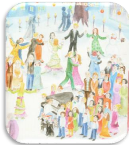
(15. Κριεκούκη, Ν. (2007). Μελωδένια πολιτεία )

Σε ένα άλλο βιβλίο, η Σχέση του παιδιού με τον παππού και τη γιαγιά προβάλλεται να συνδέεται με αρνητικά συναισθήματα στενοχωρίας και ζήλιας από το μικρό παιδί, όταν υπάρχει ο φόβος της απόρριψης ή της απώλειας της αγάπης. Ενδεικτικό είναι το απόσπασμα που ακολουθεί από το βιβλίο: