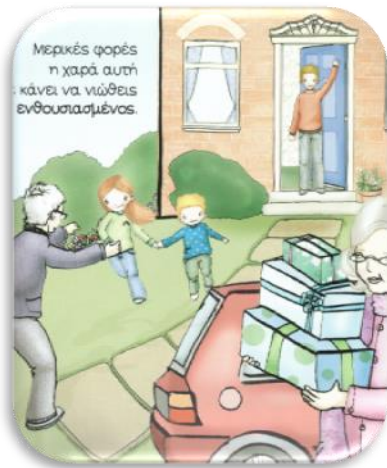
(8. Bingham, J. (2009). Νιώθω... Ευτυχισμένος )