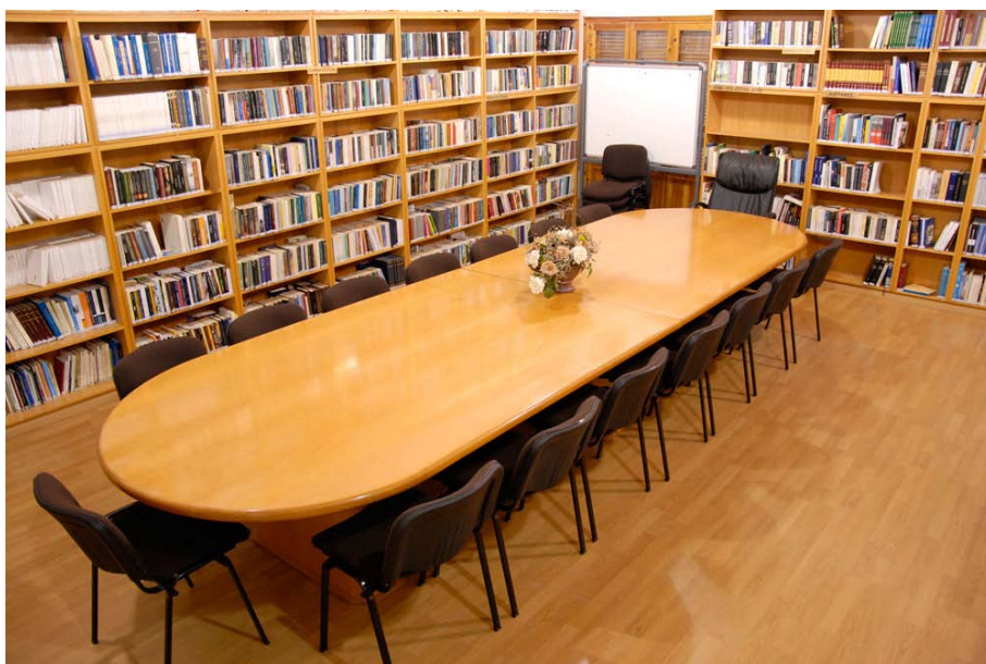
Δημοτική Βιβλιοθήκη Μέσας Γειτονιάς - Αναγνωστήριο