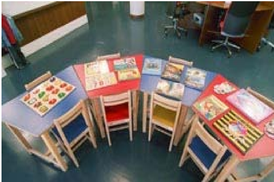
Παιδικό τμήμα Δημοτικής βιβλιοθήκης Λατσιών.