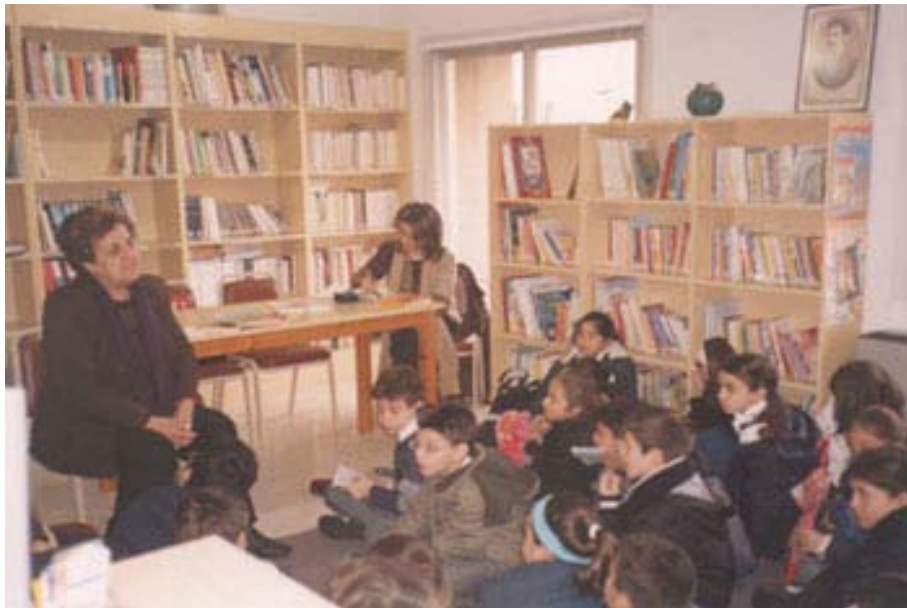
Επισκέψεις συγγραφέων στη Δημοτική βιβλιοθήκη Λακατάμιας.