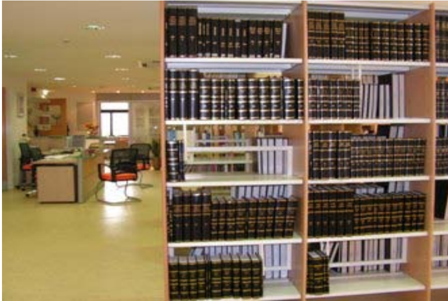
Εσωτερικός χώρος της Δημοτικής Βιβλιοθήκης Λακατάμιας