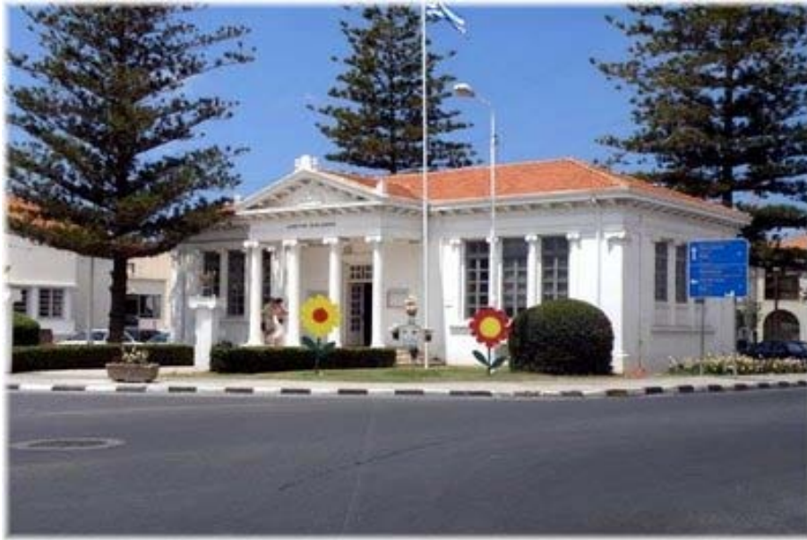
Δημοτική Βιβλιοθήκη Πάφου – Είσοδος κτηρίου