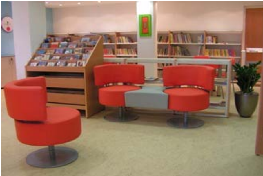
Εσωτερικός χώρος της Δημοτικής Βιβλιοθήκης Λακατάμιας