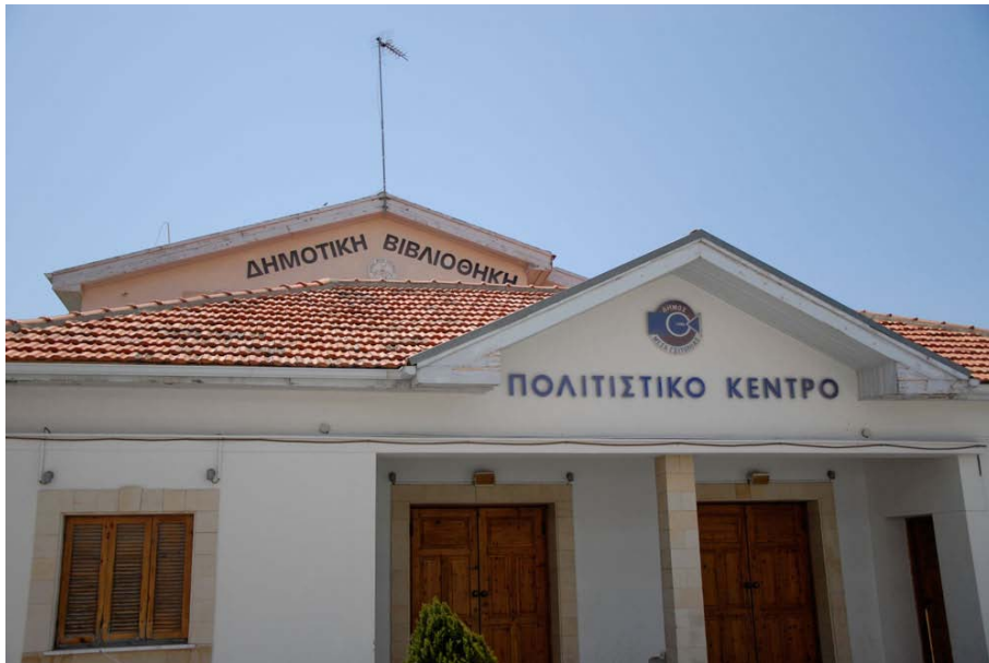
Δημοτική Βιβλιοθήκη Μέσας Γειτονιάς - Είσοδος