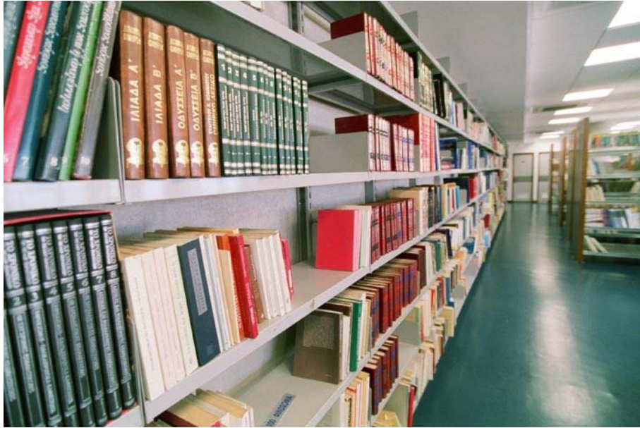
Βιβλία που προσφέρει στους χρήστες η δημοτική βιβλιοθήκη Λατσιών.