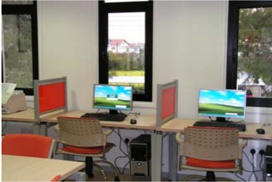
Ηλεκτρονικοί Υπολογιστές της Δημοτικής Βιβλιοθήκης Λακατάμιας με πρόσβαση στο διαδίκτυο