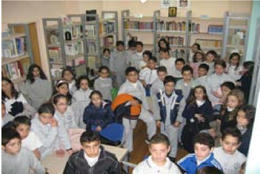
Επίσκεψη Δημοτικών σχολείων στη Δημοτική Βιβλιοθήκη Λάρνακας