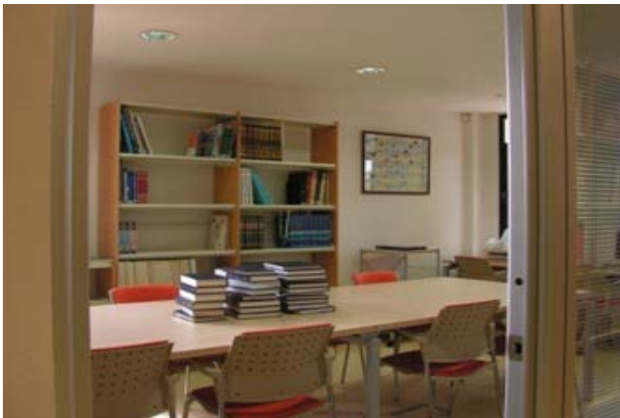
Εσωτερικός χώρος της Δημοτικής Βιβλιοθήκης Λακατάμιας