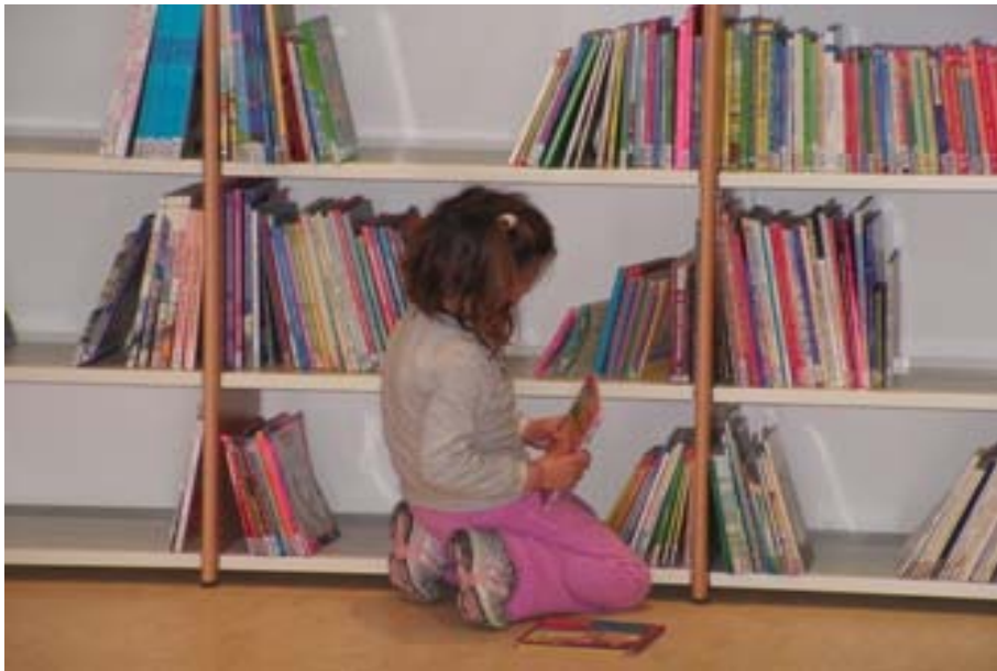
Παιδικό τμήμα Δημοτικής Βιβλιοθήκης Λακατάμιας