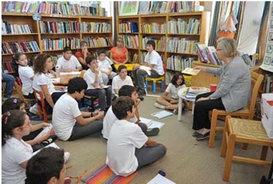
Λογοτεχνικά πρωινά στη Δημοτική βιβλιοθήκη Στροβόλου