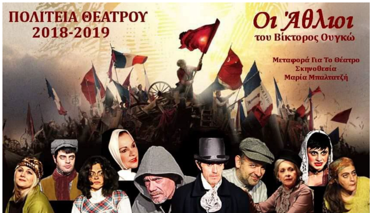
(Αφίσα της παραστασης «Οι Άθλιοι» της Πολιτείας Θεάτρου η οποία έκανε περιοδεία σε όλα τα Σωφρωνιστικά Καταστήματα της Βόρειας Ελλάδας.).