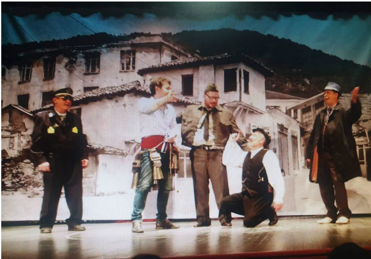
(Λαογραφική Ομάδα Γυναικών Σοχού).