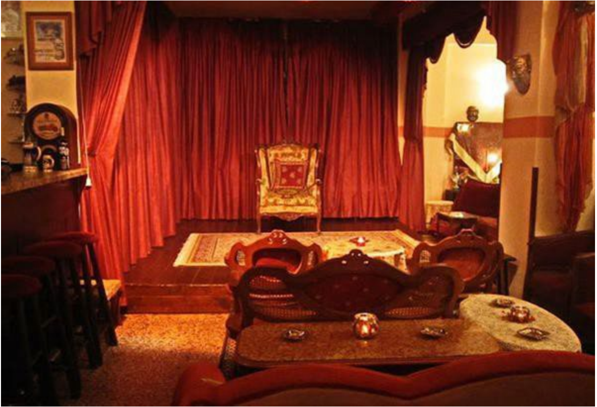
(Άποψη της σκηνής του Θεατρικού Σαλονιού της Πολιτείας Θεάτρου. Φωτογραφία Μαρίας Μπαλτατζή)