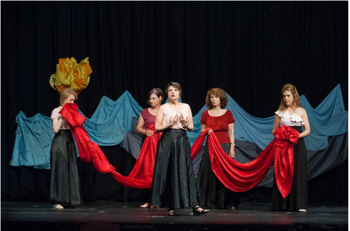
Θεατρική ομάδα «Άλμα ζωής», φωτογραφία από το αρχείο της ομάδας.