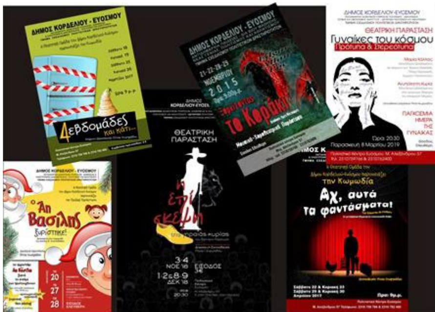
(Αφίσες από θεατρικές παραστάσεις της Θεατρικής Ομάδας Δήμου Κορδελιού-Ευόσμου.).

Άλλη μια ενδιαφέρουσα ομάδα είναι η ART MATES THEATER GROUP 27 . Επίσημα η ομάδα ιδρύθηκε το 2015 στη Θεσσαλονίκη. Ξεκίνησε από τη περιοχή των Συκεών και στη συνέχεια μεταφέρθηκε στο κέντρο της Θεσσαλονίκης. Τα ιδρυτικά μέλη της ομάδας ήταν 10. Ξεκίνησε με 15 συμμετέχοντες και τώρα αριθμεί 10. Ασχολείται με κλασικά, σύγχρονα έργα, αρχαίες τραγωδίες, ποίηση, με θέατρο τεκμηρίωσης (!).