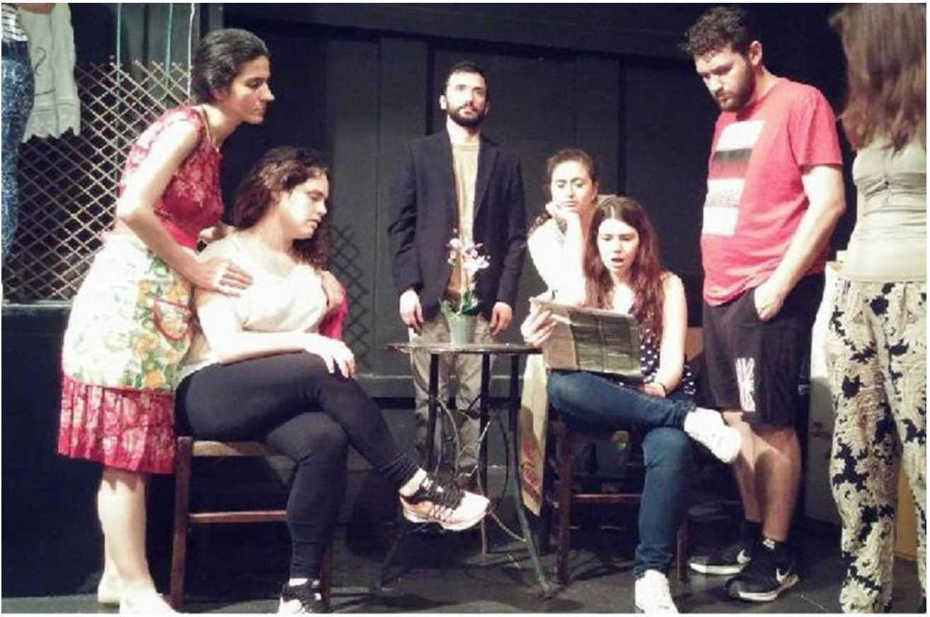
(Από την παράσταση «Οι Γερμανοί ξανάρχονται», Θεατρική ομάδα «Άγιος Πορφύριος ο μίμος»).