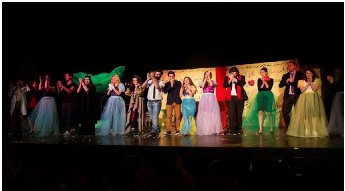
(Από την παράσταση «Ο Όσκαρ και η Κυρία με τα Ροζ», Θεατρική ομάδα «Άγιος Πορφύριος ο Μίμος»2020).