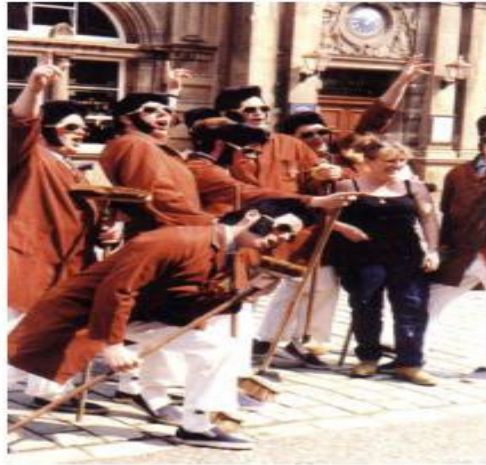
Από παράσταση Θεάτρου Δρόμου του Walkabout Theatre (στο βιβλίο In Situ, European Artists on the Road , εκδόσεις L' entretemps, 2006).

Αυτό το είδος θεάτρου δεν είναι νέα μέθοδος. Χρησιμοποιήθηκε π.χ. κατά το μεσοπόλεμο από τους Ντανταϊστές . Από τον Boal και άλλους που εφαρμόζουν το Θέατρο του Καταπιεσμένου, με προσπάθειες να συστηματοποιηθεί η μέθοδος, με σαφείς στόχους και κριτήρια.