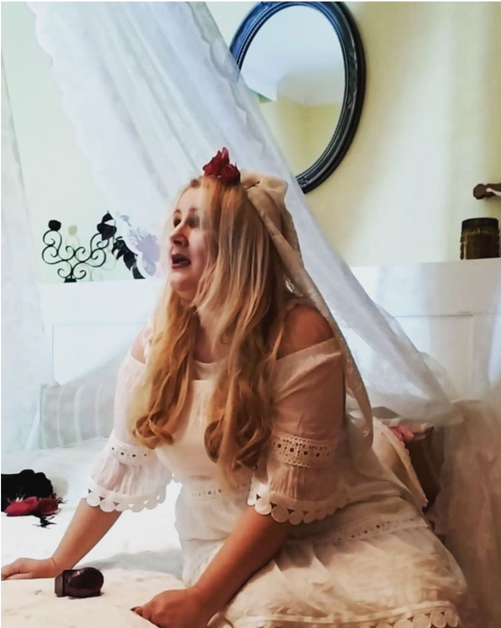
(Ρωμαίος και Ιουλιέτα)