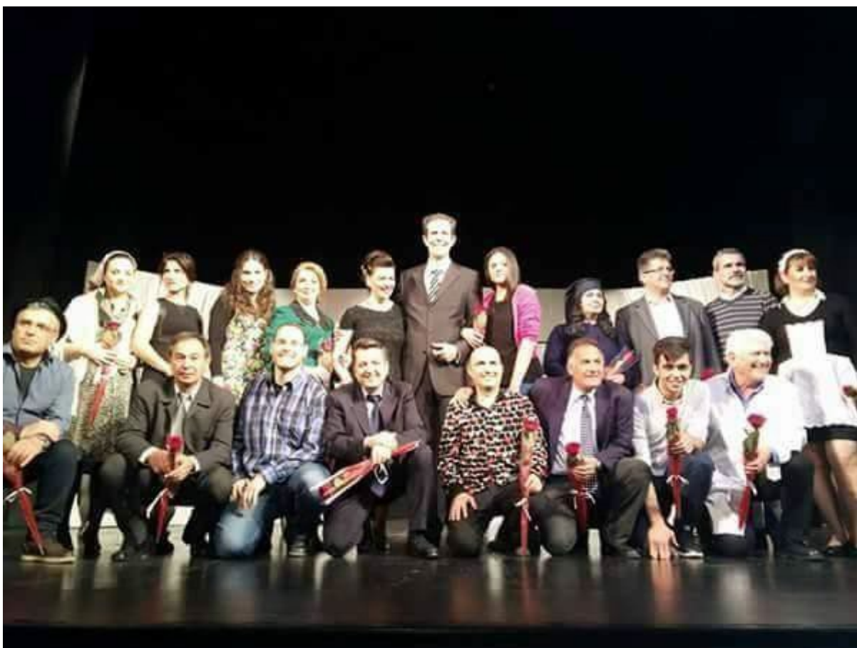
(Θεατρική ομάδα ΨΑΟ ΕΛΤΑ Σταυρούπολης).

Η θεατρική ομάδα του ΨΑΟ ΕΛΤΑ Σταυρούπολης . Ιδρύθηκε το 2016 στο κατάστημα ΕΛΤΑ Σταυρούπολης από δύο άτομα. Τώρα αριθμεί δεκαπέντε άτομα. Ο χώρος στον οποίο δραστηριοποιείται είναι το κατάστημα ΕΛΤΑ της Σταυρούπολης και δεν έχει δική της σκηνή. Τα έργα της τα παρουσιάζει όπου της γίνει πρόσκληση, συνήθως σε δημοτικά θέατρα και σκηνές. Τα έργα που προτιμά συνήθως είναι κωμωδίες. Απευθυθύνεται σε όλους. Σκηνοθέτιδα – εμπυχωτρία το 2016 -2017 είχαν την Ευτυχία Νιόβη Κιτριδου και από το 2019 έως και σήμερα την Ιωάννα Γεωργαντά. Συμμετέχουν ενήλικες ερασιτέχνες από 40-60 χρονών και δύο έφηβοι δεκαπέντε και δεκαέξι χρονών! Οι ενήλικες είναι όλοι υπάλληλοι των Ελληνικών Ταχυδρομείων. Η δημιουργία έχει συμμετοχικό χαρακτήρα. Τα θεατρικά κείμενα επιλέγονται από τα μέλη μετά από ομαδική ανάγνωση. Πάντα το κλίμα είναι ευδιάθετο και όλοι εξελίχθηκαν πνευματικά μέσα από αυτό, σύμφωνα με τα λεγόμενα της σκηνοθέτιδας. Την 1η τους χρονιά ανεβάσαν την παράσταση «Εταιρεία Θαυμάτων» του Δημήτρη Ψαθά το (2017), το 2018 το «Υπάρχει και φιλότιμο» του Αλέκου Σακελλάριου και το 2019 αποσπάσματα από παλιές ελληνικές ταινίες. Τα έργα τους τα παρουσιάσαν στο Δημοτικό Θέατρο Ευόσμου, στο Δημοτικό Θέατρο Θέρμης, στο Θέατρο «Αλέξανδρος» και στο Δημοτικό Θέατρο «Τσακίρης».