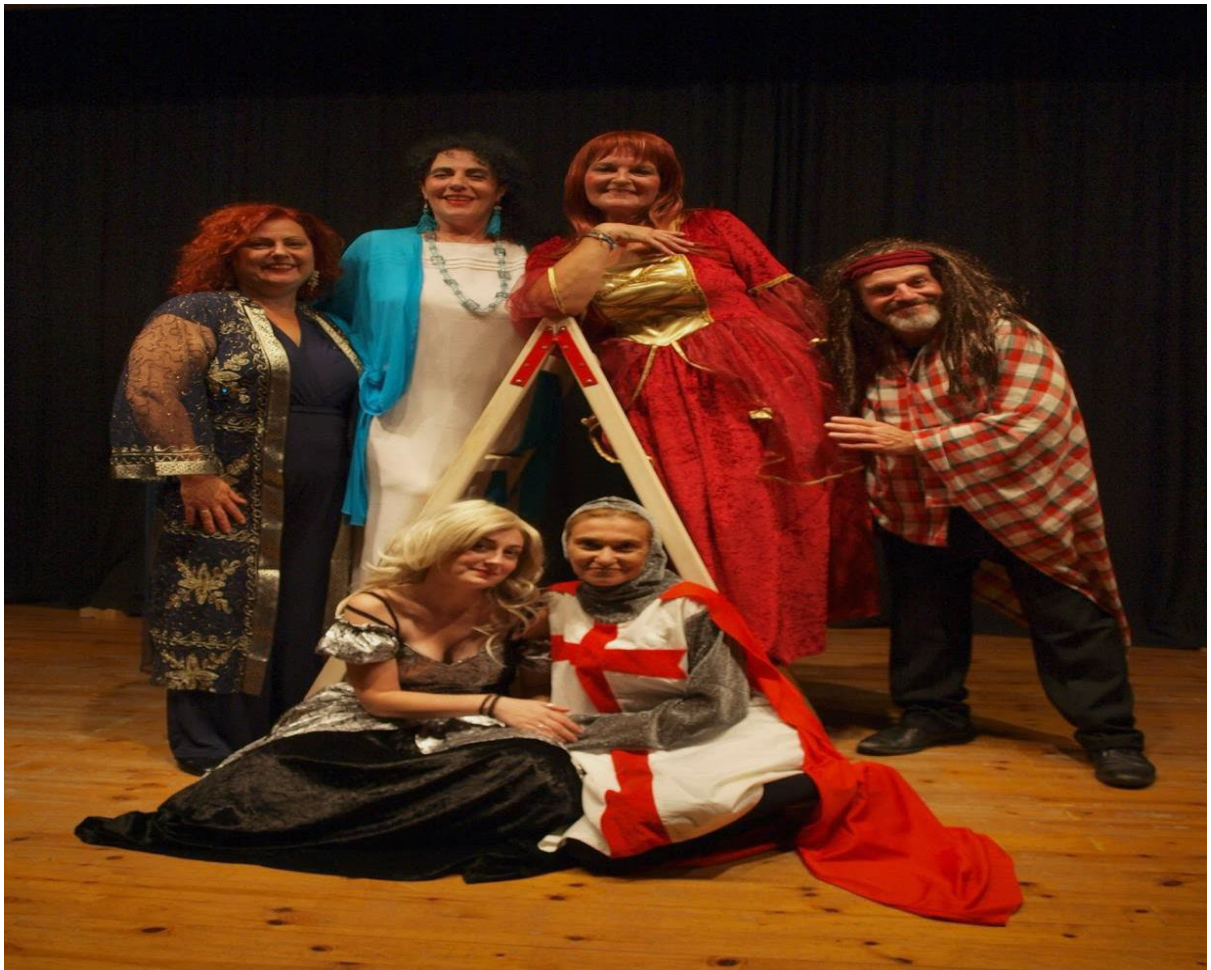
(Θεατρική Ομάδα Θεατράλε)

Οι παραστάσεις της ομάδας έχουν παρουσιαστεί στο Θέατρο "Αλέξανδρος" του Κέντρου Πολιτισμού Περιφέρειας Κεντρικής Μακεδονίας, στο Θέατρο «Αλέξης Μινωτής» του Δήμου Αμπελοκήπων Μενεμένης, στο Θέατρο Κάππα 2000 στην Περαιά, στο Δημοτικό