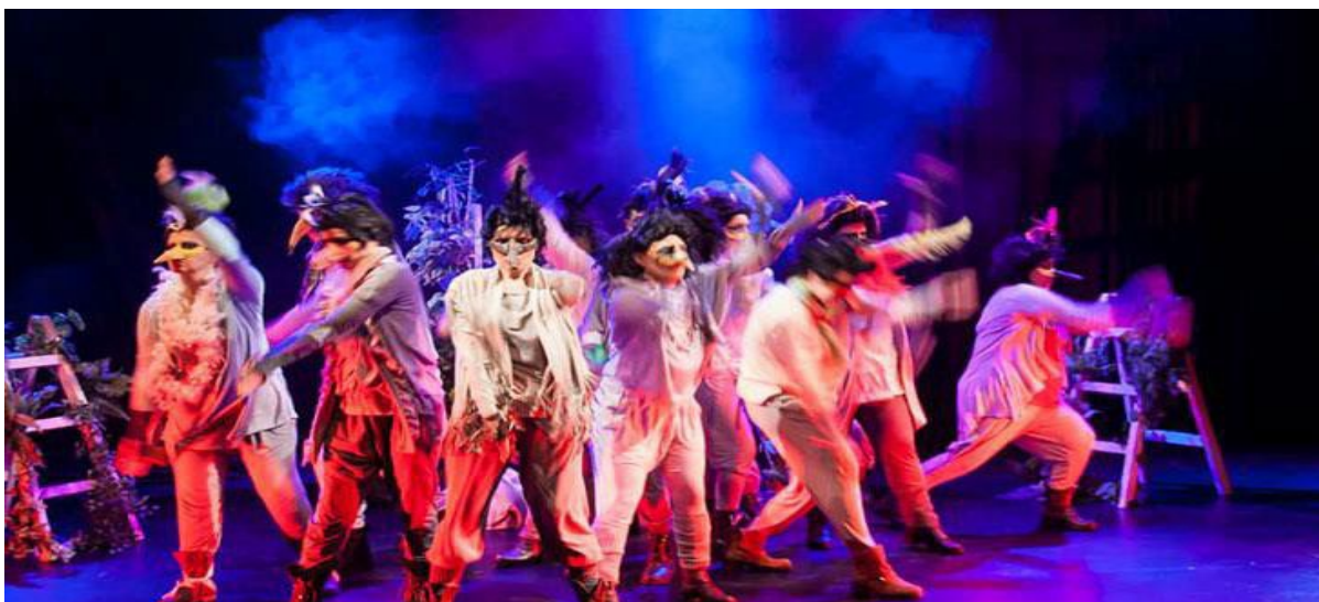
(Φωτογραφίες παραστάσεων Θεατρικής ομάδας Συλλόγου «Καλλίστη».Απο το αρχείο του Συλλόγου).

Η θεατρική ομάδα « Ένεπε Μούσα » ιδρύθηκε τον Απρίλιο του 2008 στον Πολύγυρο Χαλκιδικής από δύο άτομα. Κάποια στιγμή αριθμούσε 20 άτομα και σήμερα είναι 7 βασικά άτομα. Έχει συνεργαστεί με 50 περίπου άτομα όλα αυτά τα χρόνια.