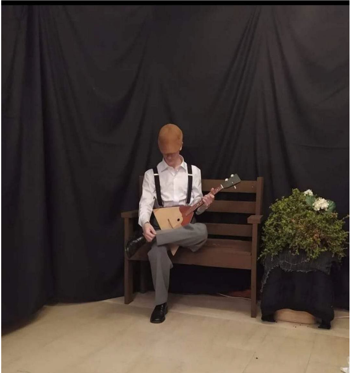
(Ο Θεός Βάνια, φωτογραφία: Τοπάλη Μαρία).