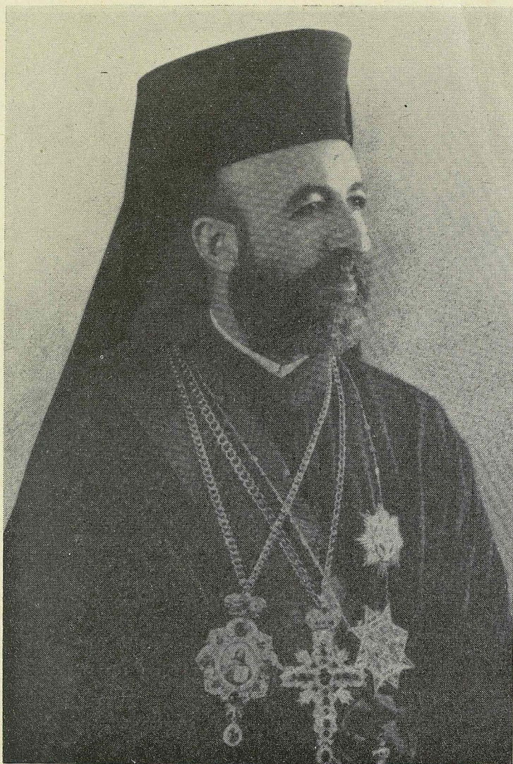
+ Ό Κύπρου Μακάριος