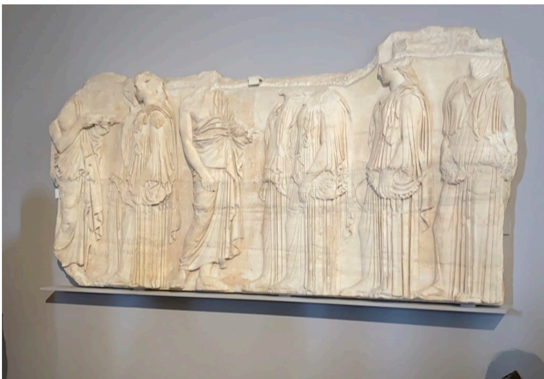
Κομμάτι της Ζωφόρου που εκτίθεται στο Μουσείο του Λούβρου Φώτο 15/08/2022

του Παρθενώνα στους εκάστοτε διευθυντές του Βρετανικού Μουσείου και τους διαδόχους τους επ' αορίστου. Η κυριότητα του Βρετανικού Μουσείου είναι αδιαφιλονίκητη για τα αγγλικά δικαστήρια. Η αρμόδια επιτροπή επί του θέματος αναγνώριζε την αξία των Γλυπτών μεν αλλά απόφυγε δε να αναφερθεί στο αμφισβητήσιμο ιδιοκτησιακό τίτλο του Έλγιν. Ταυτόχρονα η επιτροπή δεν έκανε οποιασδήποτε μορφής έλεγχο και ταυτοποίηση στα λεγόμενα του πρώην πρέσβη της. Η επιτροπή κρίνεται από ιστοριογράφους ότι φέρει ευθύνη για τα ελλιπή συμπεράσματά καθώς φαίνεται ότι δεν προσπάθησε να πάρει πληροφορίες κι από άλλες πηγές (Robertson, 2020: 106).