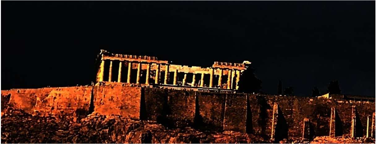
Φωτογραφία 05/09/2018, Αθήνα