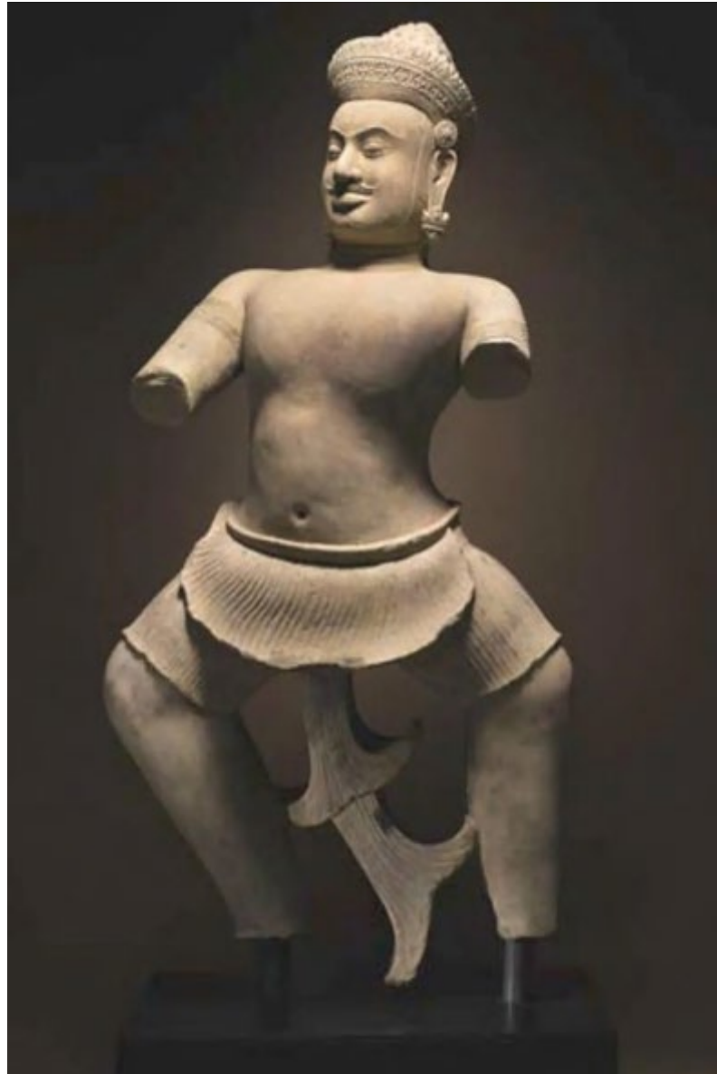
Εικόνα 2. Το άγαλμα του ινδουιστή πολεμιστή Duryodhana από το ναό του Koh ker που βρέθηκε στον οίκο δημοπρασιών Sotheby's

Το άγαλμα του πολεμιστή τοποθετήθηκε σε εξώφυλλο του καταλόγου του οίκου δημοπρασιών το έτος 2011 και είχε χαρακτηριστεί ως ένα ασυναγώνιστο αριστούργημα. Μάλιστα, στη λεζάντα του εξωφύλλου αναγραφόταν ότι εάν κάποιος ήθελε να αποκτήσει ένα γλυπτό το οποίο θα αντιπροσωπεύει τον πολιτισμό των Khmer, αυτό ήταν το άγαλμα του πολεμιστή (Mashberg & Blumenthal, 2013).