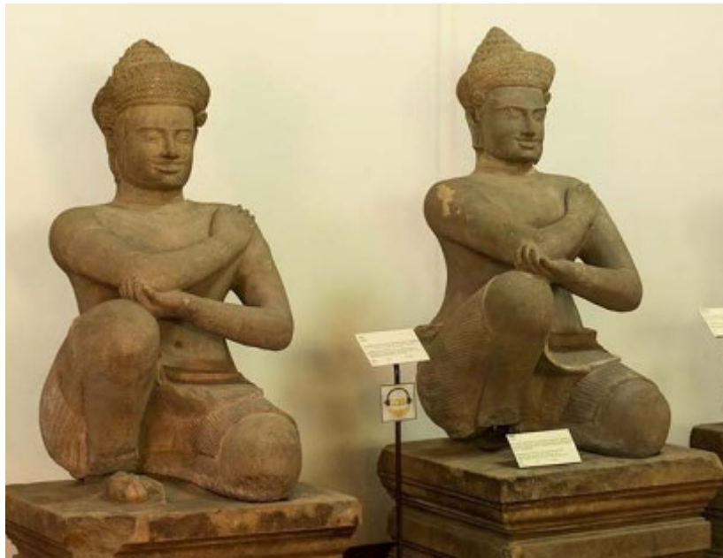
Εικόνα 3. Οι γονατιστοί παρατηρητές (kneeling attendants) – αδερφοί Pandavas στο Μουσείο Metropolitan