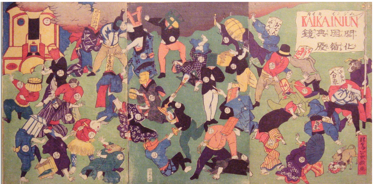
Εικόνα A8: Η συνάντηση του «παλιού» με το «νέο»: Χαρακτικό της περιόδου της Αυτοκρατορίας Meiji στην Ιαπωνία του 19 ου αιώνα, σε μια εποχή όπου το άνοιγμα των συνόρων της χώρας και οι δυτικές επιρροές αντιμετώπιστηκαν από μέρος των ντόπιων διανοουμένων ως απειλή για την τοπική παράδοση.