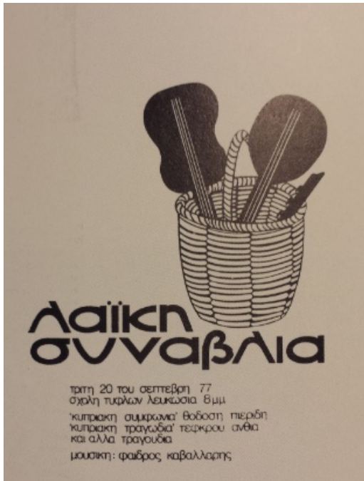
Εικόνα Α1: