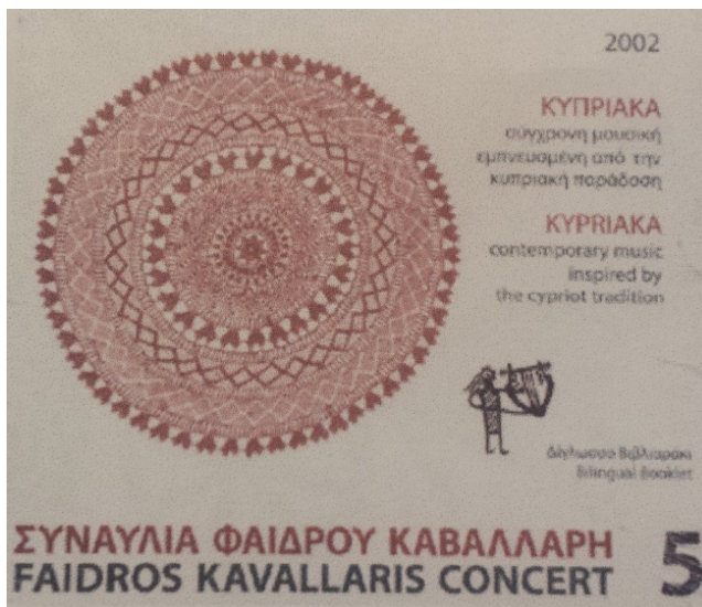
Εικόνα Α2: