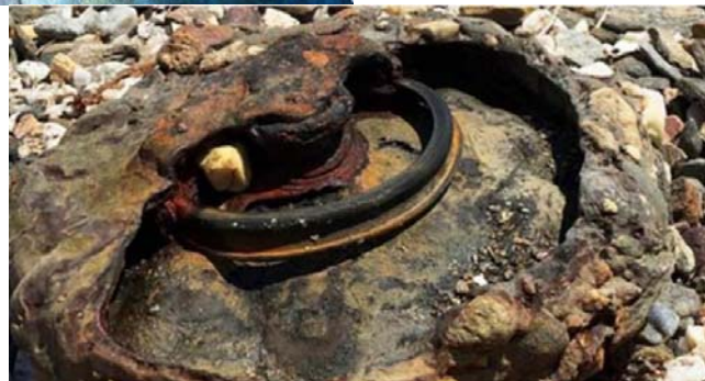
Εικ. 7. Πυρομαχικά από τον Β΄ Παγκόσμιο Πόλεμο σε διάφορες περιοχές της Ελλάδας. Διαθέσιμο στο https://www.protothema.gr/greece/article/501831/volos-vrethike-narki-apo-ton-v-pagosmio-polemo/ (ημερομηνία τελευταίας πρόσβασης 21/11/2019)