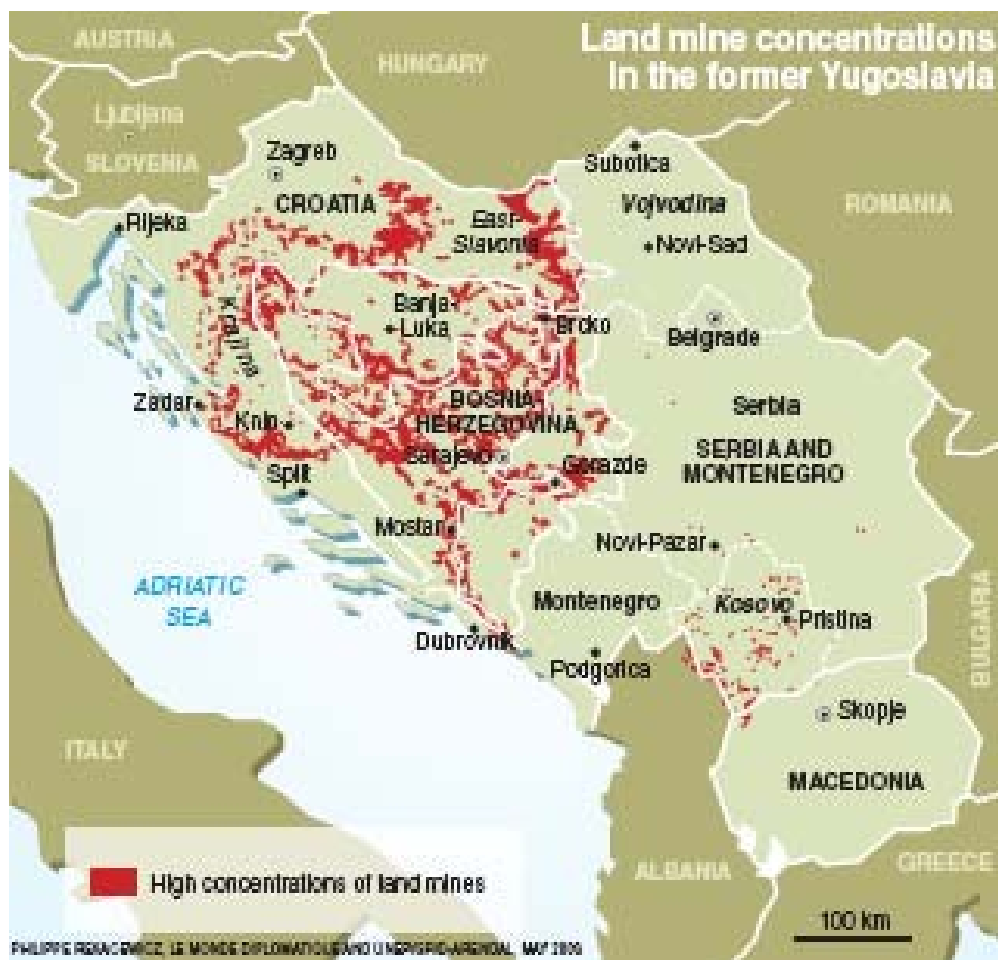
Εικ. 19. Συγκεντρώσεις ναρκών εδάφους στην ΠΓΔΜ ( UNEP, UNDP, OSCE, 2003).