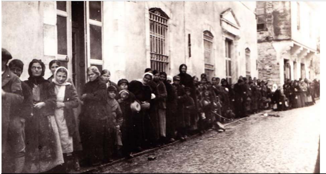
Εικ. 20. Καβάλα: η λεγόμενη «γραμμή του ψωμιού»