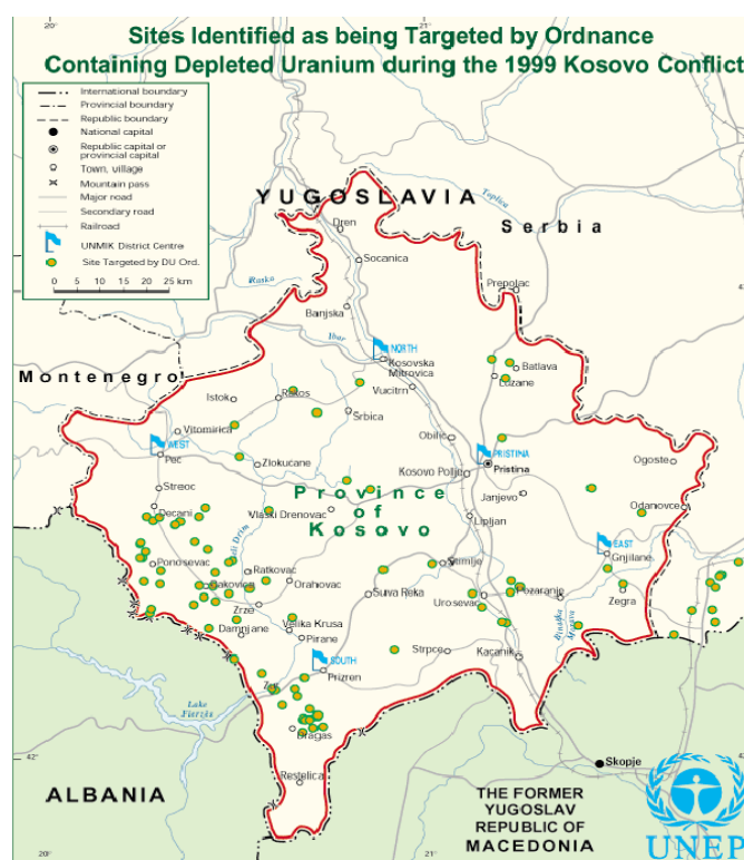
Εικ. 9. Οι περιοχές - στόχοι που επλήγησαν με βλήματα απεμπλουτισμένου ουρανίου κατά τη διάρκεια του πολέμου στο Κόσσοβο (UNEP, 2000).