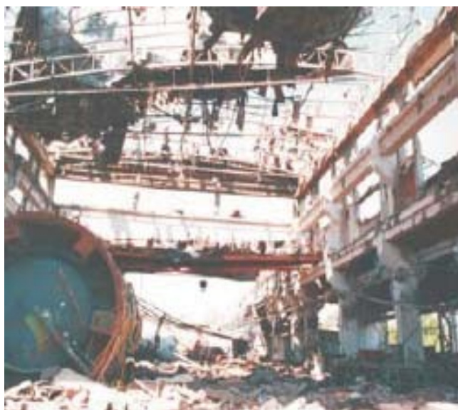
Εικ. 14. Το βομβαρδισμένο εργοστάσιο της Zastava ( UNEP, 2004)