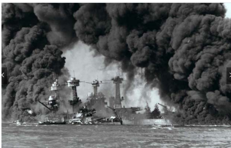
Εικ. 11. Πλοία που φλέγονται κατά τον Β΄ Παγκόσμιο Πόλεμο.