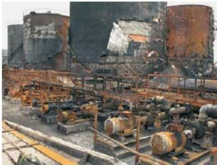
Εικ. 13. Novi Sad, οι ζημιές από τον βομβαρδισμό στο διυλιστήριο πετρελαίου (UNEP, 2004).