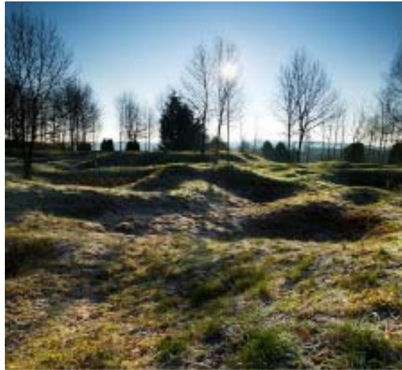
Εικ. 4. Κρατήρες στο έδαφος εξαιτίας βομβαρδισμών (Τσιούρη, 2015).