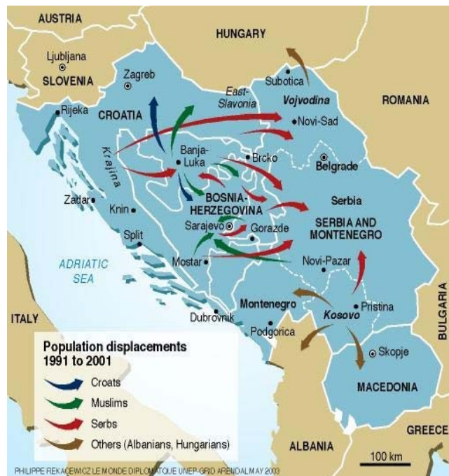
Εικ. 21. Οι μετακινήσεις πληθυσμών στην περιοχή των Βαλκανίων ως συνέπεια του διαμελισμού της πρώην Γιουγκοσλαβίας