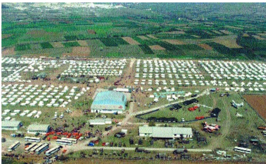
Εικ. 15. Το στρατόπεδο συγκέντρωσης προσφύγων Stenkovec 1 ( UNEP, 2000).