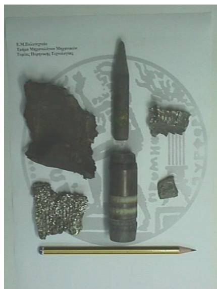
Εικ. 8. Βλήμα απεμπλουτισμένου ουρανίου, που μετρήθηκε από το ΕΜΠ ΕΜΠ, Τομέας Πυρηνικής Τεχνολογίας, Διαθέσιμο στο http://nuclear.ntua.gr/apache2-default (ημερομηνία τελευταίας πρόσβασης 21/11/2019).