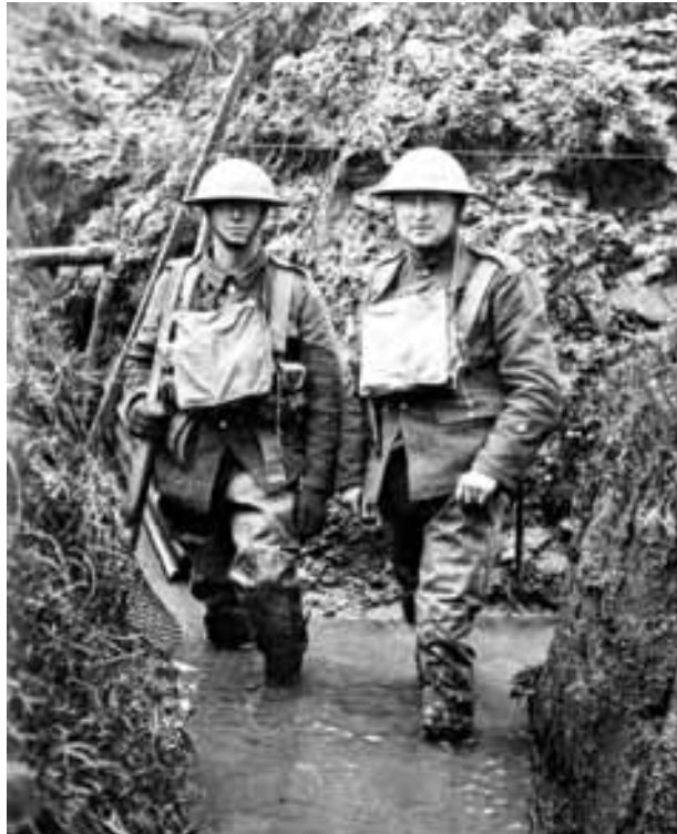
Εικ. 5. Στρατιώτες στα λασπωμένα χαρακώματα κατά τον Α΄ Παγκόσμιο Πόλεμο (Leonard, 2012).