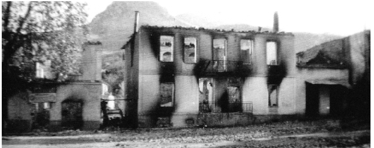
Εικ. 18. Τοπίο ολοκληρωτικής καταστροφής στα Καλάβρυτα 31 Δεκεμβρίου 1943 (Τσιούρη, 2015)