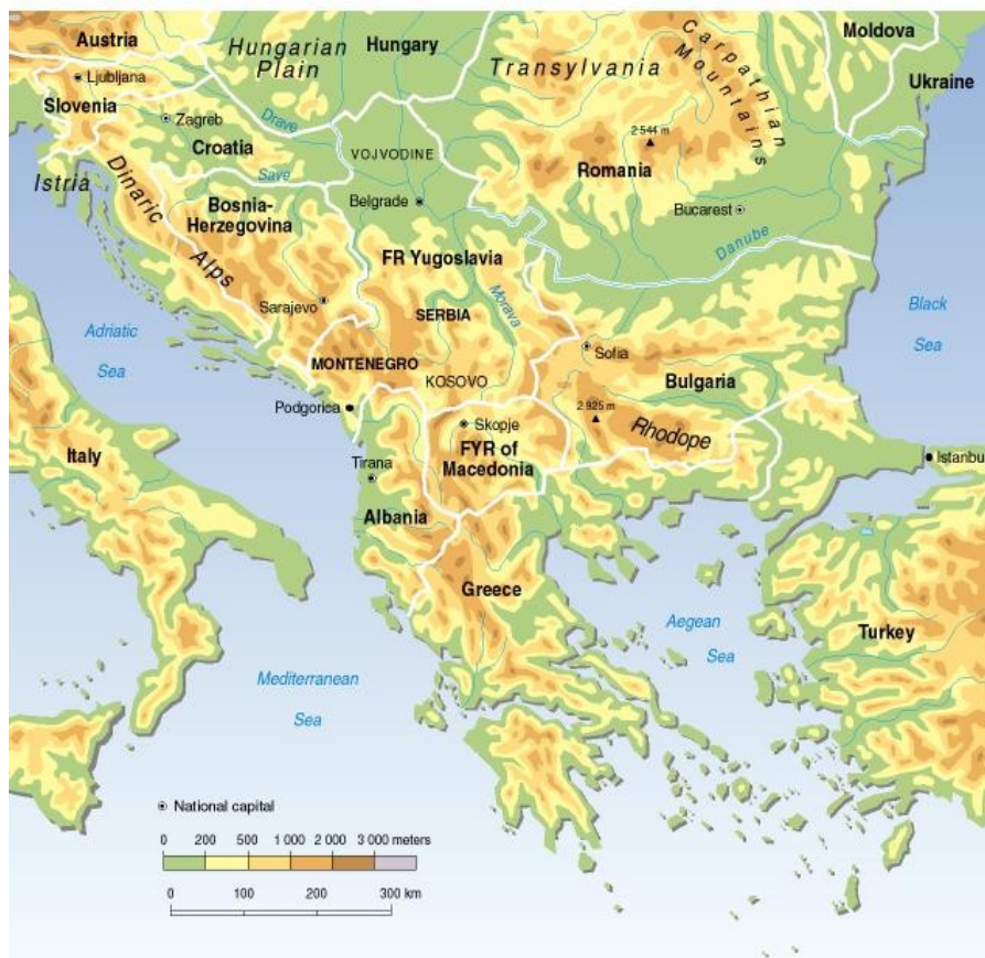
Εικ. 1. Οι χώρες της Βαλκανικής Χερσονήσου Atlas de Poche, Philippe Rekacewicz, Le Livre de Poche, 1996, Διαθέσιμο στο http://maps.grida.no/go/graphic/balkans_topographic_and_political_map (Ημερομηνία τελευταίας πρόσβασης 10/11/2019)