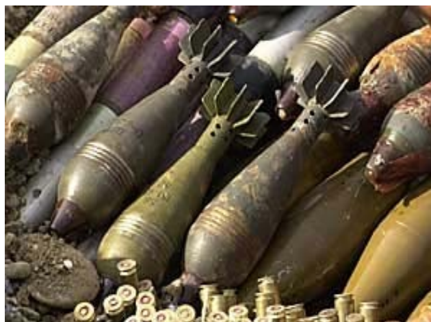
Εικ. 10. Νάρκες στο έδαφος της πρώην Γιουγκοσλαβίας. Διαθέσιμο στο http://www.osce.org/item/10997.html (ημερομηνία τελευταίας πρόσβασης 21/11/2019).