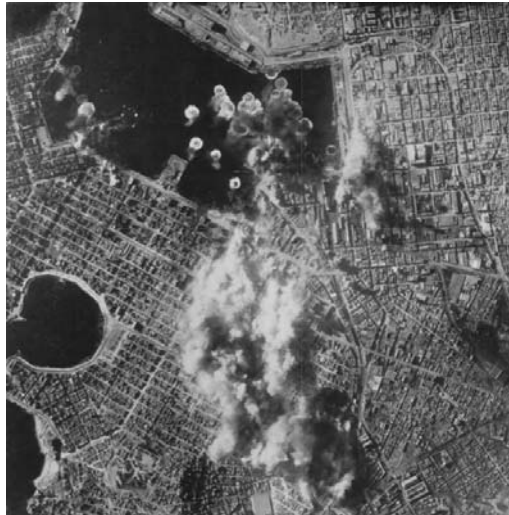
Εικ. 2. Ο Βομβαρδισμός του Πειραιά κατά τον Β΄ Παγκόσμιο Πόλεμος, Διαθέσιμο στο https://www.efsyn.gr/nisides/180976-otan-oi-symmahoi-skorpisan-ton-thanato-ston-peiraia (ημερομηνία τελευταίας πρόσβασης, 9/11/2019).