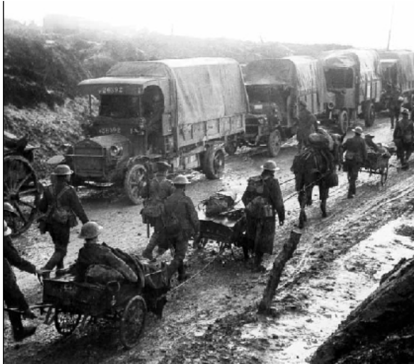
Εικ. 6. Άφιξη στρατιωτών στο μέτωπο, τοπίο απέραντης λάσπης (Leonard 2012).