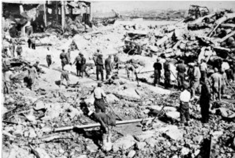
Εικ. 17. Βομβαρδισμός της Αθήνας από τους Γερμανούς, Διαθέσιμο στο https://www.militaire.gr/toso-misos-o-vomvardismos-tis-athinas-apo-toys-germanoys-3-meres-prin-fygoyn-san-simera-to-1944/ (ημερομηνία τελευταίας πρόσβασης 21/11/2019)