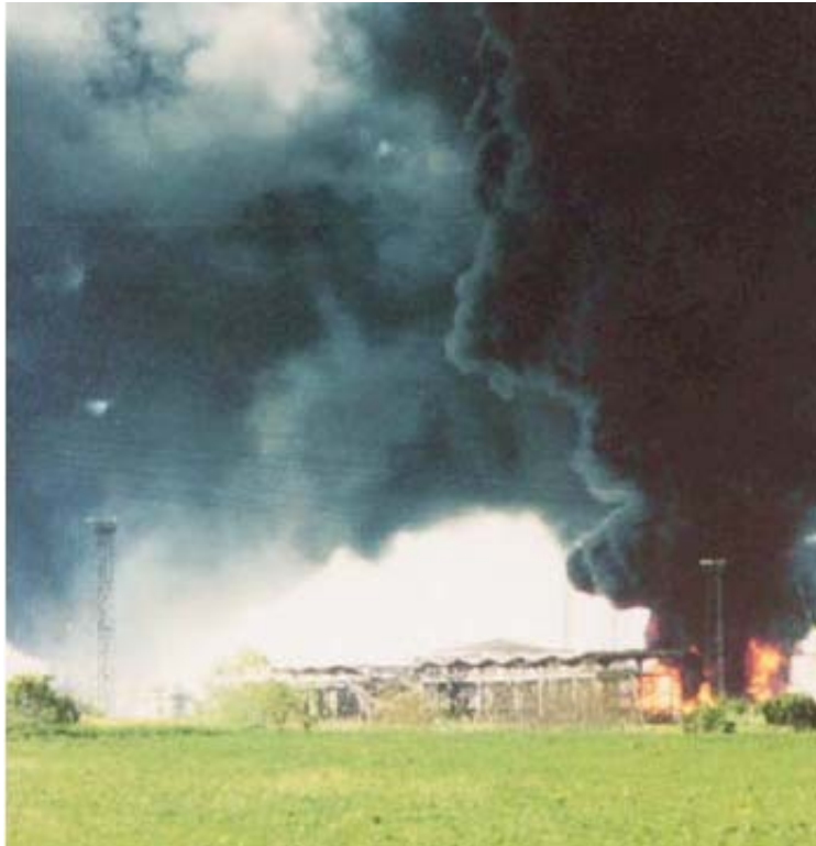
Εικ. 12. Φωτιά στο πετροχημικό εργοστάσιο του Rancevo (UNEP, 2004)