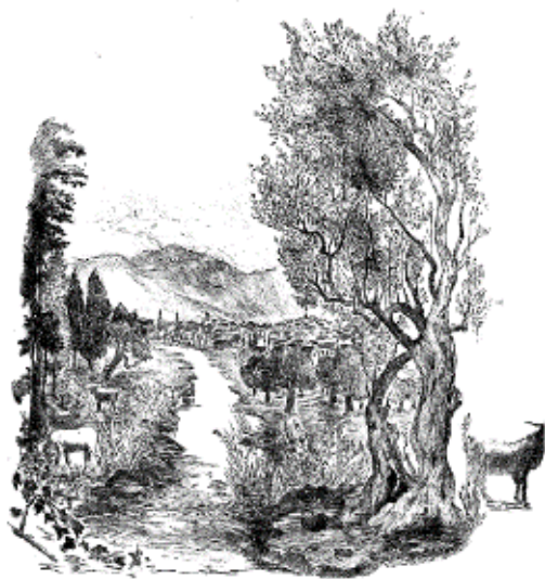
Εικόνα 20: Λέλα Πασχάλη, Ελαιόδεντρα (Σπάρτη) , 1954. Χαλκογραφία, διαστάσεις έργου 32 χ 23,5 εκ. (πηγή: Γρηγοράκης, Ν. (2004). Η ελιά στη Νεοελληνική Χαρακτική , σ. 83. Μεσσήνη: Δήμος Μεσσήνης, Μουσείο Χαρακτικής Τάκη Κατσουλίδη, Εκδόσεις Αδάμ – Πέργαμος).