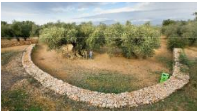
Εικόνα 63: Μνημειακές ελιές από την περιοχή El Sénia στην βορειοανατολική Ισπανία με ξερολιθιές