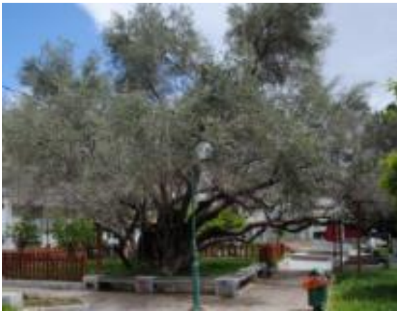
Φωτογραφία 16: Η ελιά του Πεισίστρατου στους Αγίους Αναργύρους Αττικής.