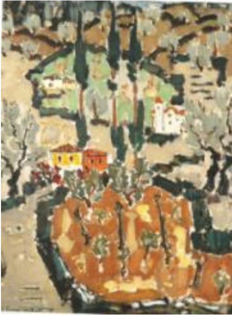
Εικόνα 11: Γιάννης Σπυρόπουλος, Μένητες Άνδρου , 1952. Το έργο ανήκει στη συλλογή Μ. Νειάδα και βρίσκεται στην Αθήνα. Ελαιογραφία σε μουσαμά, διαστάσεις έργου 67 χ 54 εκ. (πηγή: Χρήστου, Χ. (1996). Ελληνική Τέχνη Ζωγραφική 20 ου αιώνα , εικ. 63, σ. 97. Αθήνα: Εκδοτική Αθηνών).