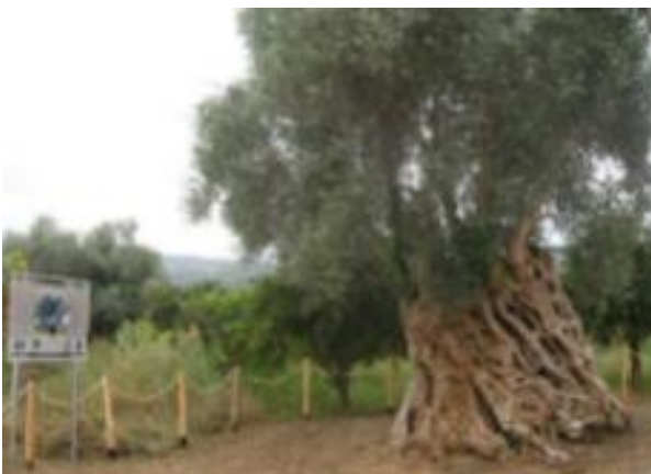
Φωτογραφία 20: Η μνημειακή «Υψωμένη Ελιά» Βατολάκκου που βρίσκεται στον Δήμο Πλατανιά της Π.Ε. Χανίων Κρήτης.