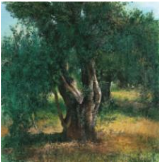
Εικόνα 14: Χρύσα Βέργη, Ελιά , 2008. Λάδι σε μουσαμά, διαστάσεις έργου 200 χ 195 εκ, αριθμός ευρετηρίου 823. (πηγή: Χρήστου, Χ. και Κατσανάκη, Μ. (2010). Έργα Τέχνης από τη συλλογή της Βουλής των Ελλήνων , εικ. 239, σ. 421. Αθήνα: Ίδρυμα της Βουλής των Ελλήνων για τον κοινοβουλευτισμό και τη Δημοκρατία).