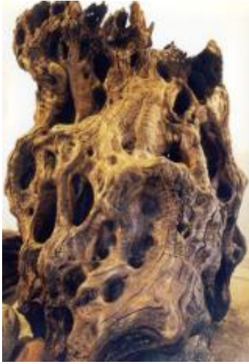
Εικόνα 54: Τμήμα του κορμού από την Ελιά του Πλάτωνα (πηγή: Μιχελάκης, Ν. (επιμ.) (2003α). «Μνημειακά Ελαιόδεντρα στον Κόσμο, στην Ελλάδα και στην Κρήτη». Ελιά και Λάδι στην Κρήτη , Πρακτικά Διεθνούς Συμποσίου Σητεία 23-25 Μαΐου 2002. σσ. 32-43, φωτ. 3. Κρήτη: ΣΕΔΙΚ).