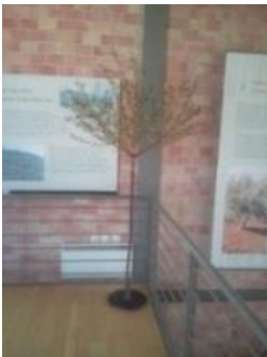
Φωτογραφία 7: Άγγελος Παναγιωτίδης, Ελιά . Το γλυπτό βρίσκεται στο Μουσείο Ελιάς και Ελληνικού Λαδιού, στη Σπάρτη.