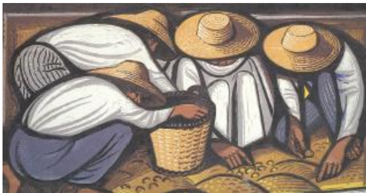
Εικόνα 22: Τάσος Α., Ο καρπός , 1959. Έγχρωμη ξυλογραφία σε πλάγιο ξύλο, διαστάσεις έργου 35,5 χ 62 εκ. (πηγή: Γρηγοράκης, Ν. (2004). Η ελιά στη Νεοελληνική Χαρακτική , σ. 95. Μεσσήνη: Δήμος Μεσσήνης, Μουσείο Χαρακτικής Τάκη Κατσουλίδη, Εκδόσεις Αδάμ – Πέργαμος).