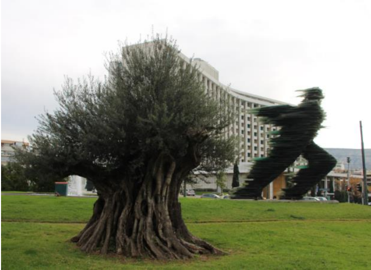
Φωτογραφία 1: Μνημειακό ελαιόδεντρο στη λεωφόρο Βασιλίσσης Σοφίας στην Αθήνα.