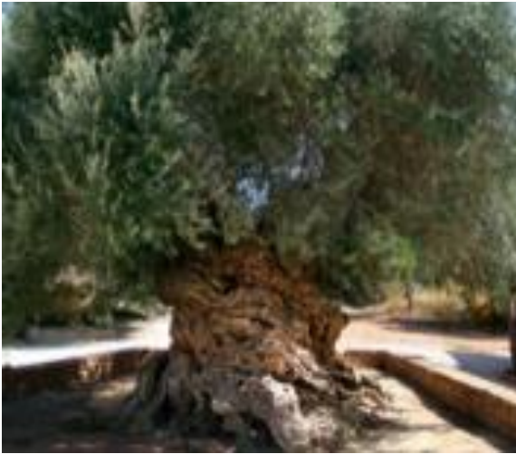
Φωτογραφία 13: Η ελιά των Βουβών Κισσάμου.