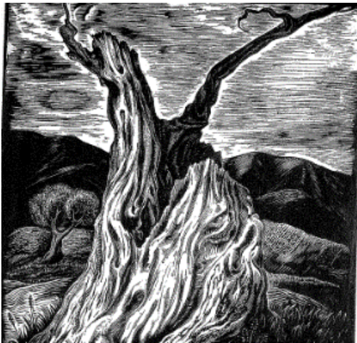
Εικόνα 19: Ευθύμης Παπαδημητρίου, Γέριχη Ελιά , 1939-40;, ξυλογραφία, διαστάσεις έργου 24,5 χ 21,8 εκ. (πηγή: Γρηγοράκης, Ν. (2004). Η ελιά στη Νεοελληνική Χαρακτική , σ. 55. Μεσσήνη: Δήμος Μεσσήνης, Μουσείο Χαρακτικής Τάκη Κατσουλίδη, Εκδόσεις Αδάμ – Πέργαμος).