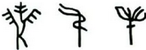
Εικόνα 47: Ιδεογράμματα Γραμμικής Β. Από αριστερά βρίσκεται το σύμβολο του ελαιόδεντρου, στο κέντρο το σύμβολο του ελαιόλαδου και στα δεξιά βρίσκεται το