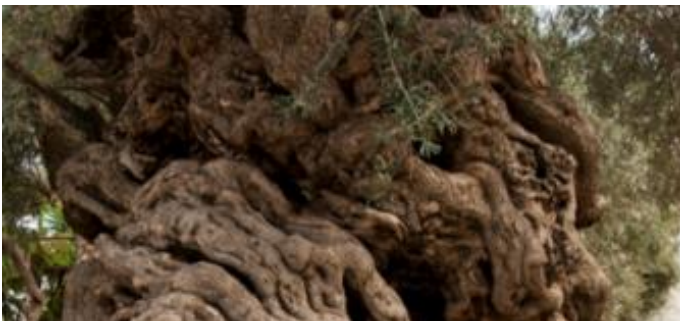
Φωτογραφία 14: Η ελιά των Βουβών Κισσάμου. Αποψη από το ανάγλυφο του κορμού.