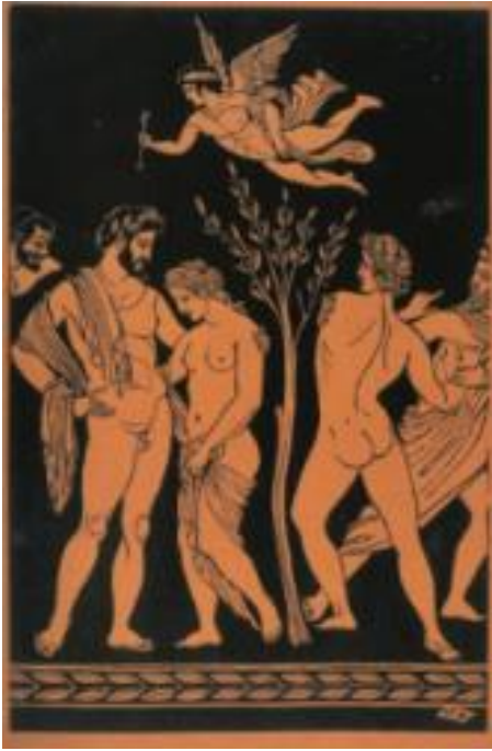
Εικόνα 17: Δημήτρης Γαλάνης, Troilus and Cressida , 1939. Δίχρωμη ξυλογραφία. (πηγή: Γρηγοράκης, Ν. (2004). Η ελιά στη Νεοελληνική Χαρακτική , σ. 33. Μεσσήνη: Δήμος Μεσσήνης, Μουσείο Χαρακτικής Τάκη Κατσουλίδη, Εκδόσεις Αδάμ - Πέργαμος).