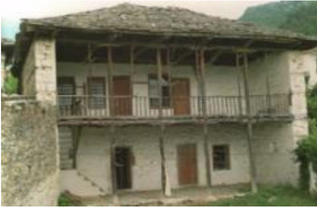
Φωτογραφία 3: Δοκοί στέγης στο χωριό Γρατινή Ροδόπης.