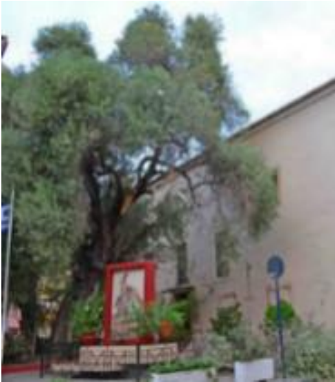
Φωτογραφία 10: Άγιος Αναστάσιος Ναυπλίου (πηγή: προσωπικό αρχείο).