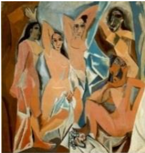
Εικόνα 10: Pablo Picasso, Les Femmes d'Alger (O.J. Version O), 1907. Το έργο βρίσκεται στο Museum of Modern Art στη Νέα Υόρκη. Λάδι σε καμβά, διαστάσεις έργου 243,9 χ 233,7, αριθμός έργου 333.1939.