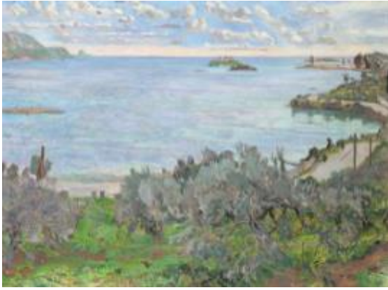
Εικόνα 15: Κώστας Παπανικολάου, Ελιά , 2003. Λάδι σε μουσαμά, διαστάσεις έργου 120 χ 161 εκ, αριθμός ευρετηρίου 550 (πηγή: Χρήστου, Χ. και Κατσανάκη, Μ. (2010). Έργα Τέχνης από τη συλλογή της Βουλής των Ελλήνων , εικ. 240, σ. 423. Αθήνα: Ίδρυμα της Βουλής των Ελλήνων για τον κοινοβουλευτισμό και τη Δημοκρατία).