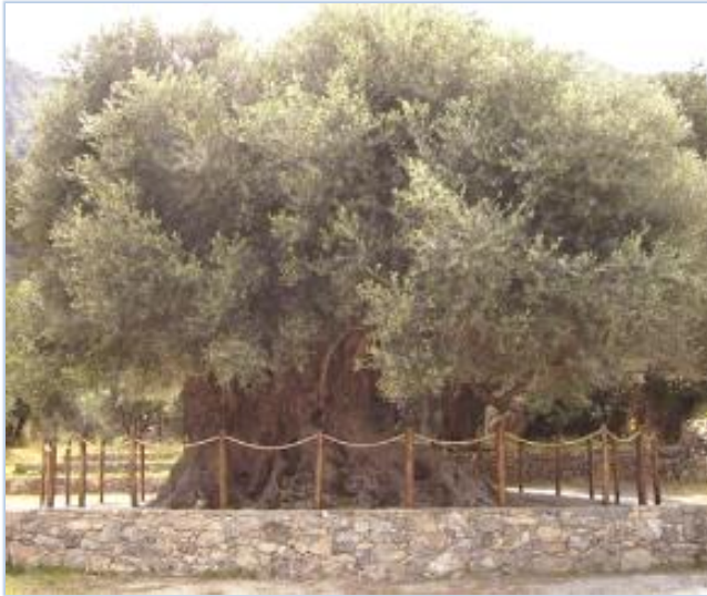
Φωτογραφία 21: Η μνημειακή ελιά Καβουσίου που βρίσκεται στο Δ.Δ. Αζοριάς – Καβουσίου του Δήμου Ιεράπετρας της Π.Ε. Λασιθίου Κρήτης.