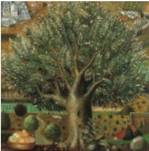
Εικόνα 13: Θόδωρος Μανωλίδης, Τοπίο της Μυτιλήνης . Λάδι σε μουσαμά, διαστάσεις έργου 98 χ 98 εκ., αριθμός ευρετηρίου 673. (πηγή: Χρήστου, Χ. και Κατσανάκη, Μ. (2010). Έργα Τέχνης από τη συλλογή της Βουλής των Ελλήνων , εικ. 225, σ. 391. Αθήνα: Ίδρυμα της Βουλής των Ελλήνων για τον κοινοβουλευτισμό και τη Δημοκρατία).