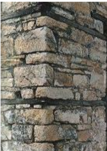
Φωτογραφία 2: Ξυλοδεσιά.