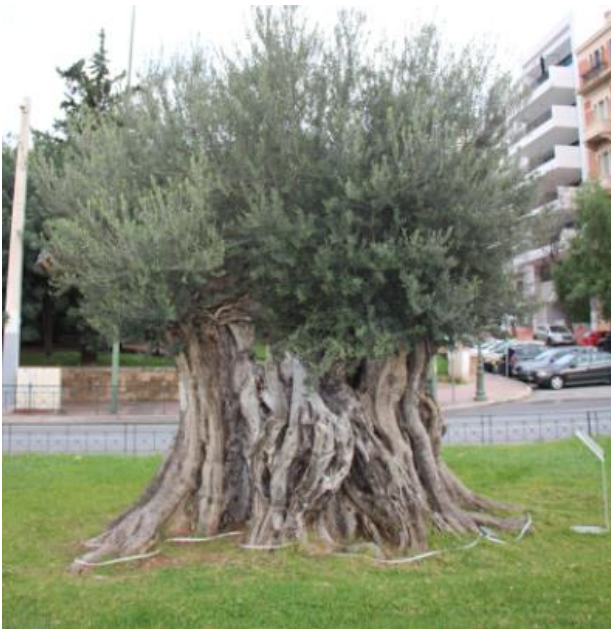
Φωτογραφία 4: Μέτρηση περιμέτρου μνημειακού ελαιόδεντρου στη λεωφόρο Βασιλίσσης Σοφίας στην Αθήνα (πηγή: προσωπικό αρχείο κ. Μαγουλά Σπυριδούλα).