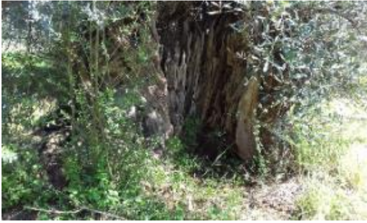
Φωτογραφία 23: Μνημειακό ελαιόδεντρο στο χωρίο Λογγάστρα του Δήμου Σπάρτης.