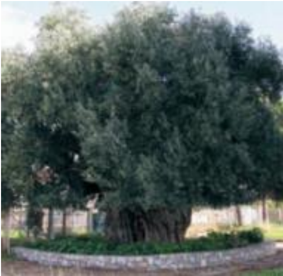
Φωτογραφία 11: Η Μάνα - Ελιά της Καλαμάτας.