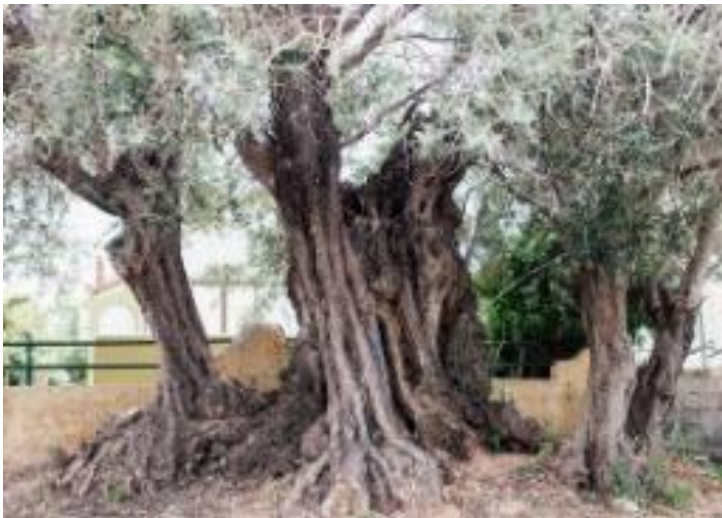
Φωτογραφία 22: Η μνημειακή Ελιά της Όρσας που βρίσκεται στην κωμόπολη Αιάντειο της Σαλαμίνας.