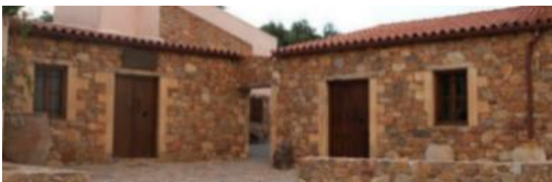
Φωτογραφία 17: Άποψη του Μουσείου Ελιάς Βουβών.