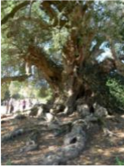
Εικόνα 66: Μνημειακή Ελιά της Λούρας που βρίσκεται βορειοανατολικά της Σαρδηνίας στην Ιταλία (πηγή: Fratus, T. (2012). Itinerari per cercatori di alberi in terra di Sardegna , p. 9. Italy: Tiziano Fratus).