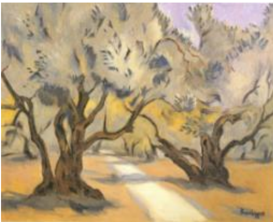
Εικόνα 12: Ορέστης Κανέλλης, Ελιές , 1975. Ελαιογραφία σε μουσαμά, διαστάσεις έργου 81 χ 100 εκ. (πηγή: Χρήστου, Χ. (1996). Ελληνική Τέχνη Ζωγραφική 20 ου αιώνα , εικ. 54, σ. 87. Αθήνα: Εκδοτική Αθηνών).