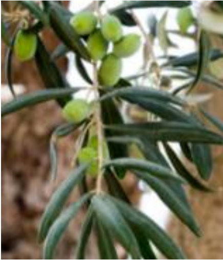
Φωτογραφία 12: Τσουνάτη ελιά.