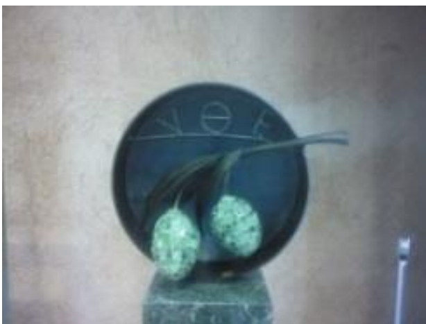
Φωτογραφία 9: Αφροδίτη Λίτη, Ελιές . Το γλυπτό βρίσκεται στο Μουσείο Ελιάς και Ελληνικού Λαδιού, στη Σπάρτη και είναι κατασκευασμένο με ψηφίδες και χαλκό.