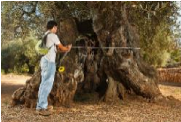
Εικόνα 61: Μνημειακή ελιά από την περιοχή El Sénia στην βορειοανατολική Ισπανία (πηγή: Europa Nostra. (20 Μαρτίου 2014). The historical landscape of El Sénia's ancient olive trees , http://www.europeanheritageawards.eu/winners/historical-landscape-el-senias-ancient-olive-trees/ [Ημερομηνία τελευταίας πρόσβασης 15-03-2019]).