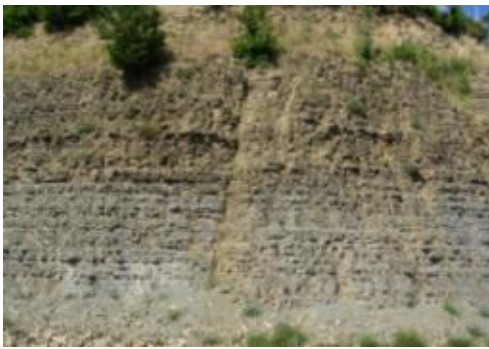
Φωτογραφία 6: Ψαμμίτης λίθος.