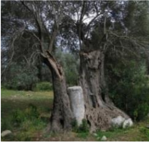
Εικόνα 5: Μνημειακή ελιά Γόρτυνας Κρήτης.