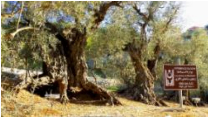
Εικόνα 67: Οι μνημειακές αδελφές ελιές που βρίσκονται στο χωριό Bechealeh στον Βόρειο Λίβανο.