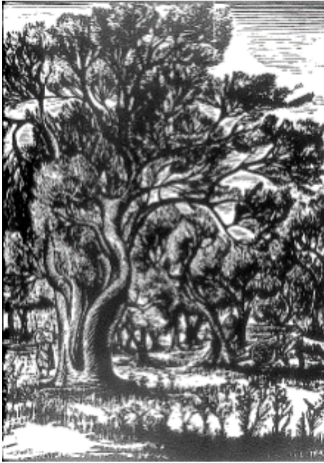
Εικόνα 23: Βάσω Κατράκη, Τοπίο με ελιές , 1950 περ. Ξυλογραφία σε πλάγιο ξύλο, διαστάσεις έργου 22 χ 25,5 εκ. (πηγή: Γρηγοράκης, Ν. (2004). Η ελιά στη Νεοελληνική Χαρακτική , σ. 97. Μεσσήνη: Δήμος Μεσσήνης, Μουσείο Χαρακτικής Τάκη Κατσουλίδη, Εκδόσεις Αδάμ – Πέργαμος).