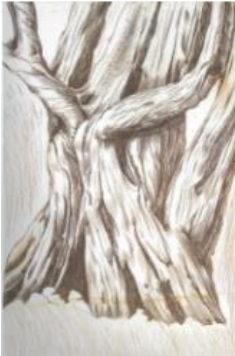
Εικόνα 26: Παναγιώτης Γράββαλος, Κορμός Ελιάς , 1982. Χαλκογραφία, διαστάσεις έργου 48,5 χ 32 εκ. (πηγή: Γρηγοράκης, Ν. (2004). Η ελιά στη Νεοελληνική Χαρακτική , σ.