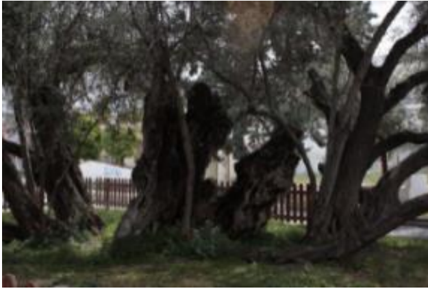
Εικόνα 45: Η ελιά του Πεισίστρατου στους Αγίους Αναργύρους Αττικής.