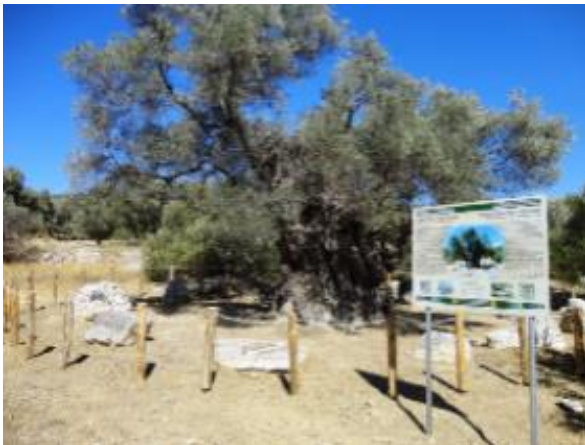
Εικόνα 57: Η μνημειακή «Μάνα Ελιά» Καμηλαρίου που βρίσκεται στο Δήμο Φαιστού της Π.Ε. Ηρακλείου Κρήτης (πηγή: Association of Crete Olive Municipalities. (2014). Conservation and Proclamation of the Monumental Olive Trees of Crete , σ. 46, εικ. 12b. Crete: Association of Crete Olive Municipalities (ACOM)).