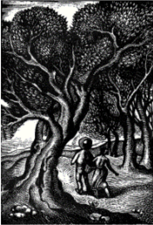
Εικόνα 21: Τάσος Α., Ελιές και Ζευγάρι , 1944. Ξυλογραφία (όρθιο ξύλο), διαστάσεις έργου 18,2 χ 12,7 εκ. (πηγή: Γρηγοράκης, Ν. (2004). Η ελιά στη Νεοελληνική Χαρακτική , σ. 89. Μεσσήνη: Δήμος Μεσσήνης, Μουσείο Χαρακτικής Τάκη Κατσουλίδη, Εκδόσεις Αδάμ – Πέργαμος).