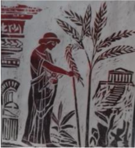
Εικόνα 25: Τάκης Κατσουλίδης, Η Αθηνά και η πρώτη ελιά , Μυθολογικό, 2004. Ευλογραφία, διαστάσεις έργου 42,5 χ 34 εκ. (πηγή: Γρηγοράκης, Ν. (2004). Η ελιά στη Νεοελληνική Χαρακτική , σ. 115. Μεσσήνη: Δήμος Μεσσήνης, Μουσείο Χαρακτικής Τάκη Κατσουλίδη, Εκδόσεις Αδάμ – Πέργαμος).