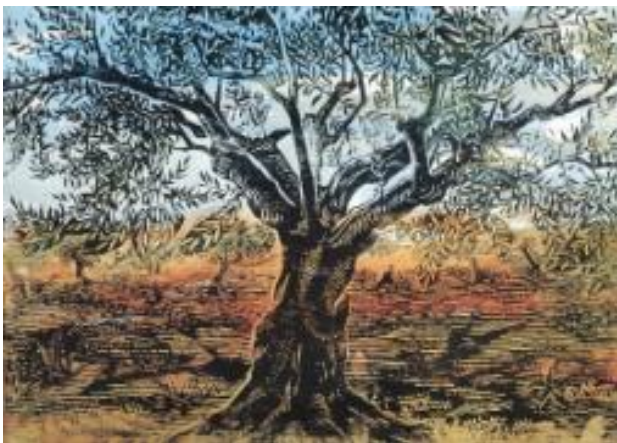
Εικόνα 24: Τάκης Κατσουλίδης, Η Ελιά , 1958. Ξυλογραφία, διαστάσεις έργου 31,5 χ 45 εκ. (πηγή: Γρηγοράκης, Ν. (2004). Η ελιά στη Νεοελληνική Χαρακτική , σ. 113. Μεσσήνη: Δήμος Μεσσήνης, Μουσείο Χαρακτικής Τάκη Κατσουλίδη, Εκδόσεις Αδάμ – Πέργαμος).