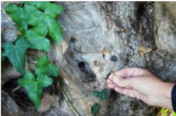
Εικόνα 55: Ξύλινο πώμα που βρέθηκε σε οπή στην μνημειακή «Υψωμένη Ελιά» Βατολάκκου του Δήμου Πλατανιά της Π.Ε. Χανίων Κρήτης (πηγή: Association of Crete Olive Municipalities. (2014). Conservation and Proclamation of the Monumental Olive Trees of Crete , σ. 81, εικ. 1. Crete: Association of Crete Olive Municipalities (ACOM)).