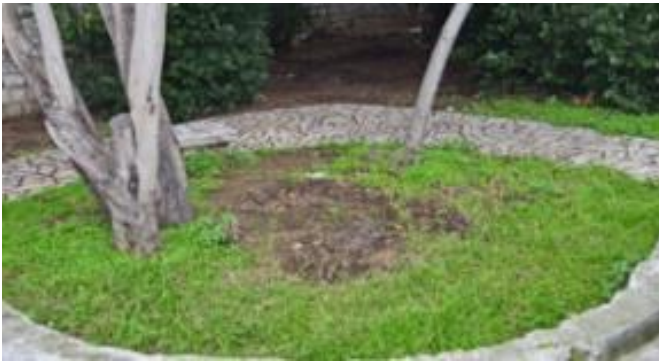
Φωτογραφία 19: Το σημείο όπου βρισκόταν τοποθετημένος ο κορμός από την Ελιά του Πλάτωνα . Η λήψη της φωτογραφίας έγινε μετά τη κλοπή του κορμού.