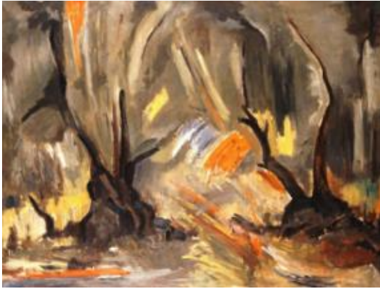
Εικόνα 9: Γιάννης Μηταράκης, Ελιές , 1960-61. Το έργο βρίσκεται στην Εθνική Πινακοθήκη και Μουσείο Αλεξάνδρου Σούτζου στην Αθήνα. Ελαιογραφία σε μουσαμά, διαστάσεις έργου 97 χ 130 εκ, αριθμός ευρετηρίου 2698 (πηγή: Χρήστου, Χ. (1996). Ελληνική Τέχνη Ζωγραφική 20 ου αιώνα , εικ. 31, σ. 64. Αθήνα: Εκδοτική Αθηνών).