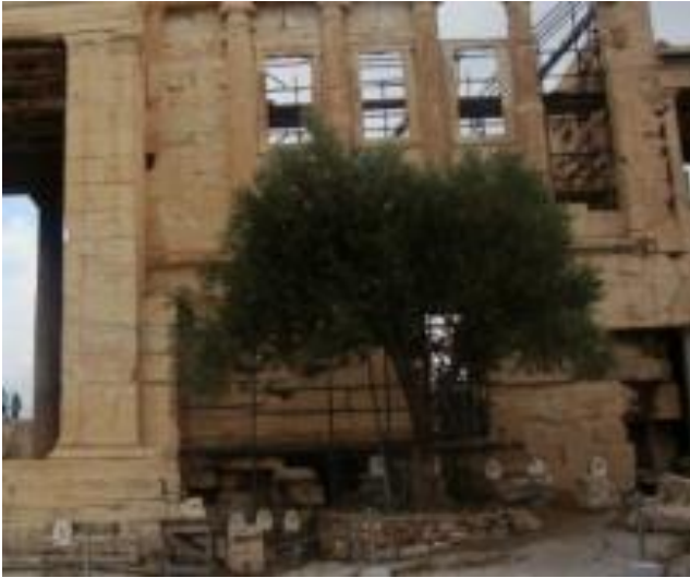
Φωτογραφία 18: Η Ελιά της Αθηνάς στο Ερέχθειο.