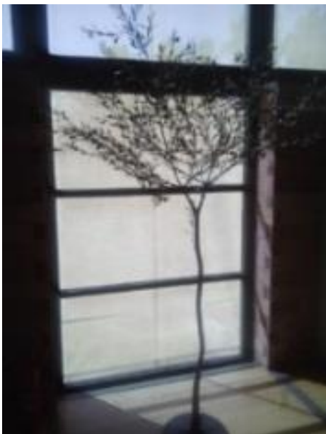
Φωτογραφία 8: Άγγελος Παναγιωτίδης, Ελιά . Το γλυπτό βρίσκεται στο Μουσείο Ελιάς και Ελληνικού Λαδιού, στη Σπάρτη.