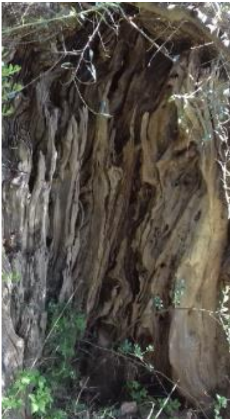
Φωτογραφία 24: Η κουφάλα από το μνημειακό ελαιόδεντρο στο χωρίο Λογγάστρα του Δήμου Σπάρτης.