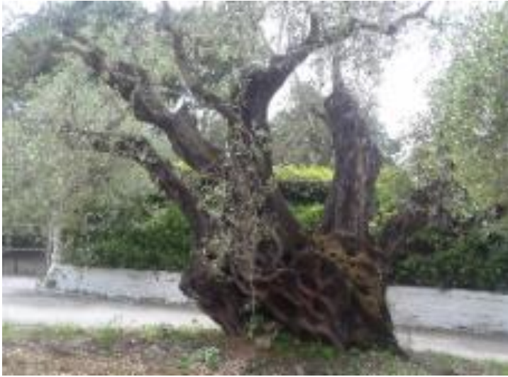
Φωτογραφία 25: Η μνημειακή ελιά που βρίσκεται στην περιοχή Ξηροπόταμος του Δήμου Καλαμάτας της Π.Ε. Μεσσηνίας.