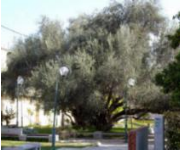
Φωτογραφία 15: Η ελιά του Πεισίστρατου στους Αγίους Αναργύρους Αττικής.