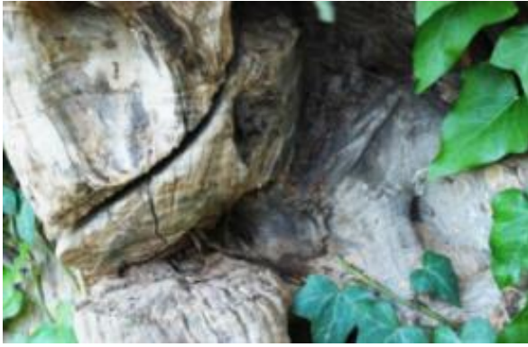
Εικόνα 56: Σημάδι από την προσπάθεια κοπής του κορμού της μνημειακής «Υψωμένης Ελιάς» Βατολάκκου του Δήμου Πλατανιά της Π.Ε. Χανίων Κρήτης (πηγή: Association of Crete Olive Municipalities. (2014). Conservation and Proclamation of the Monumental Olive Trees of Crete , σ. 81, εικ. 2. Crete: Association of Crete Olive Municipalities (ACOM)).