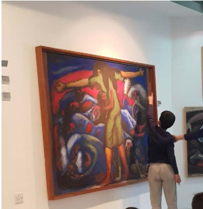
Εικ. 9 Ανακαλύπτοντας μορφές στο έργο « Οι Αγώνιες » του Αδαμάντιου Διαμαντή