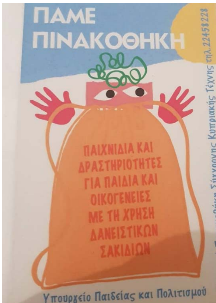
Εικ. 2 Αναμνηστικό μαγνητάκι στους μαθητές