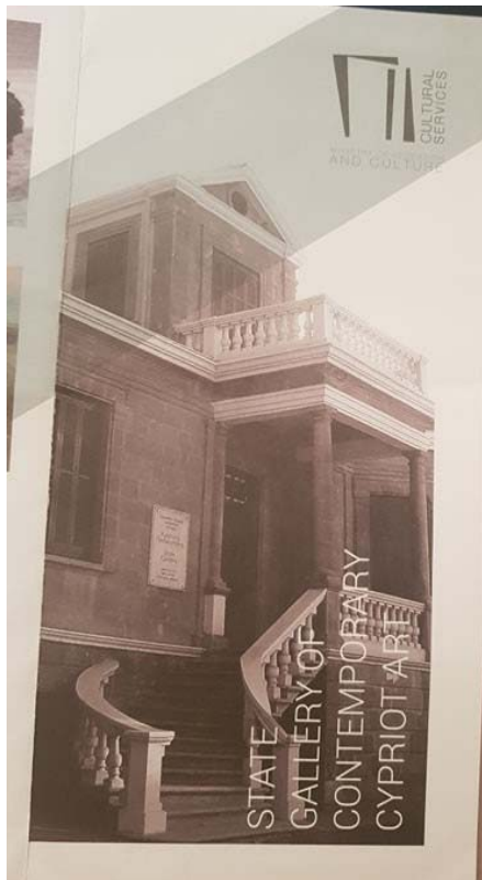
Εικ. 5 Ενημερωτικό έντυπο Κρατικής Πινακοθήκης Λευκωσίας