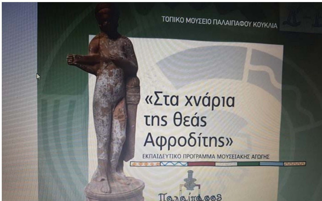
Εικ. 7 Έντυπο από βιβλιαράκι Δραστηριοτήτων