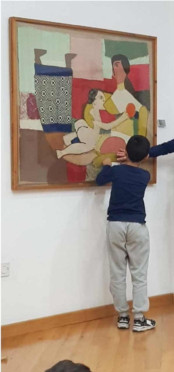
Εικ. 1 Οι μαθητές εδώ προσπαθούν να εντοπίσουν τα σχήματα σύμφωνα με τα σχήματα που έχουν κόψει από τα υφάσματα που τους έχει μοιράσει η μουσειοπαιδαγωγός σύμφωνα με τις δραστηριότητες του προγράμματος « Ο παιδικός κόσμος της Πινακοθήκης.»