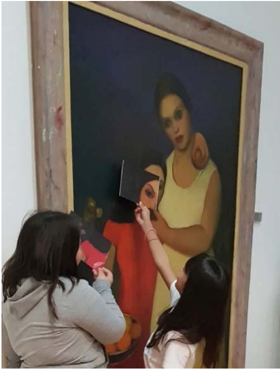
Εικ. 11 Τα παιδιά εδώ προσπαθούν να τοποθετήσουν τις καρτελίτσες που τους δόθηκαν στο σωστό σημείο του πίνακα.