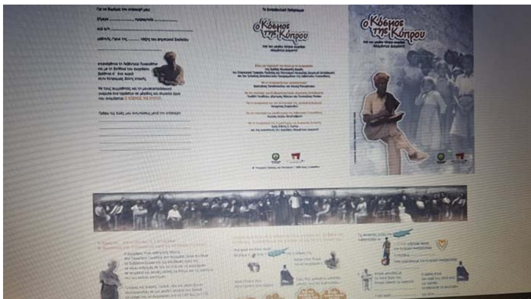
Εικ. 6 Έντυπο από βιβλιαράκι δραστηριοτήτων