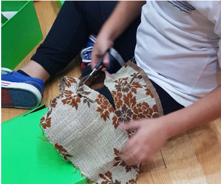
Εικ. 3 Πραγματοποίηση δραστηριοτήτων κόβοντας σχήματα στα υφάσματα