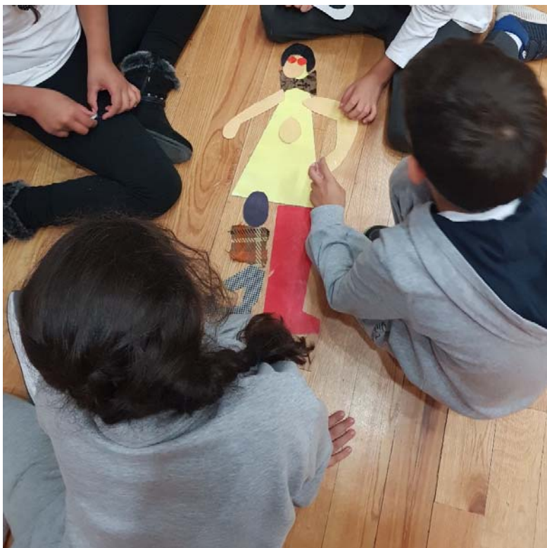
Εικ. 4 Ομαδικές δραστηριότητες κατά την διεξαγωγή του προγράμματος