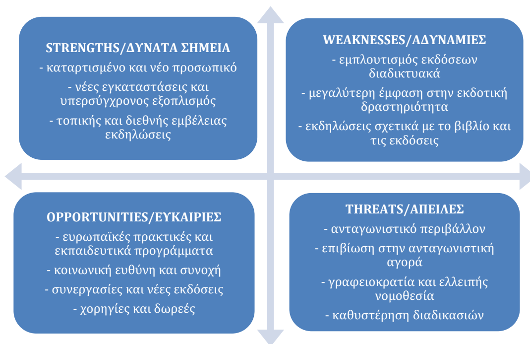
Διάγραμμα 2: Ανάλυση υφιστάμενης κατάστασης «Λεβέντειος Πινακοθήκη» (SWOT analysis).