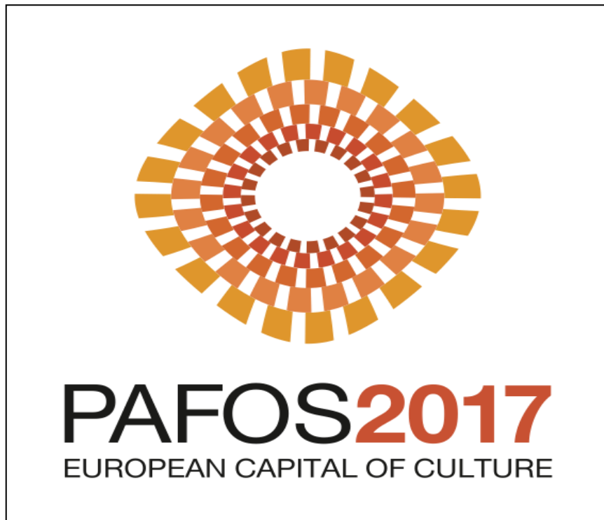
Εικόνα 2: Λογότυπο ΠΠΕ Πάφος 2017 ( www.pafos2017.eu )