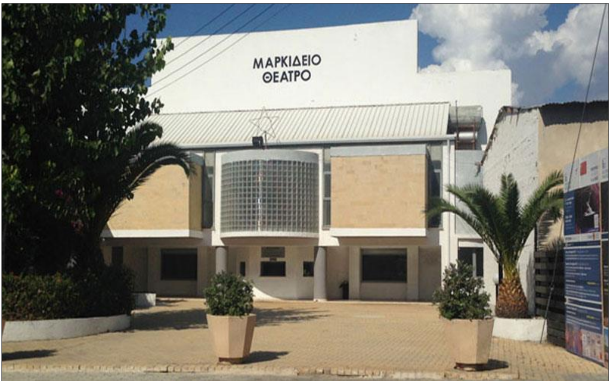
Εικόνα 5: Μαρκίδειο Θέατρο.