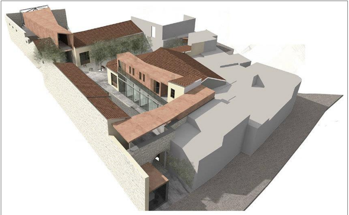
Εικόνα 4: Χάνι του Ιμπραήμ – αποκατάσταση.