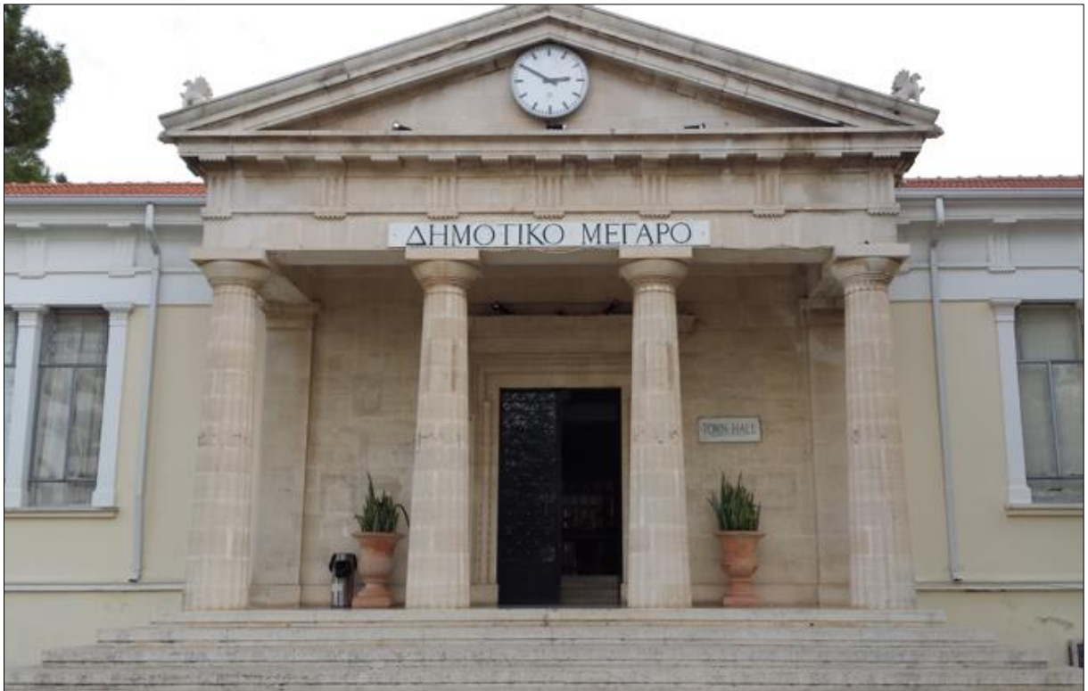
Εικόνα 6: Δημοτικό Μέγαρο Πάφου.