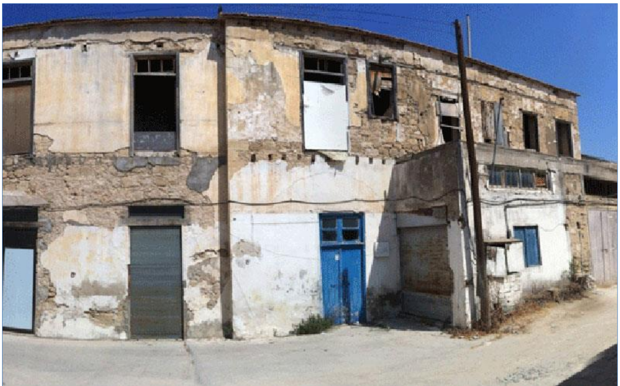
Εικόνα 3: Το Χάνι του Ιμπραήμ.